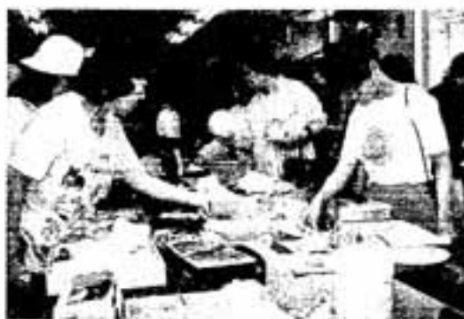
掘り出し物はあるかな

7月13日、市中心障害者共同作業所白ゆり園で、同園親の会「白ゆり会」が主催したバザーが行われました。