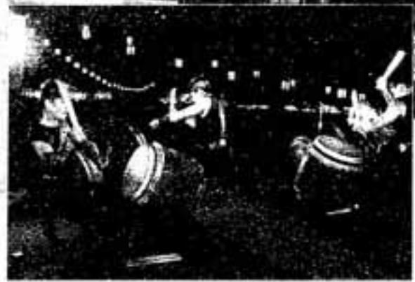
△昨年のステージイベント

春日市の夏の定番として市民に親しまれている「春日あんどん祭り」は今年21回目を迎えます。 この祭りをもっと楽しむために、知っておくと便利な情報をお知らせします。 会場見取り図も参考にし、お出かけください。