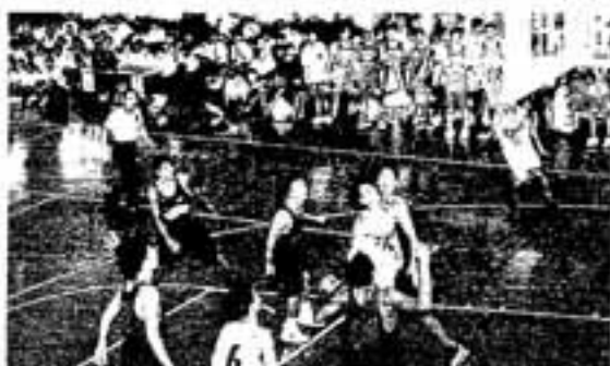
生徒の応援を受けて白熱するゲーム