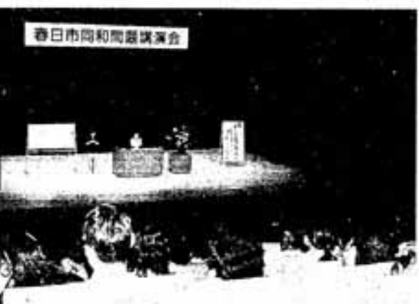
春日市同和問題講演会

「人間の手をつくった差別は、人間の手でなくそう」「ありのままの姿で差別を受けない社会こそが、差別のない社会である」といった話に、参加者たちは何度もうなずきながら、熱心に耳を傾けていました。