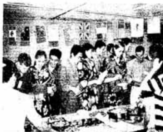
△市民が持ち寄った料理を囲んで

その後、全員が浴衣を羽織り、参加した約50人の市民と一緒に七夕かざりを作ったり、炭坑節を楽しく踊ったりして日本の夏を初体験。