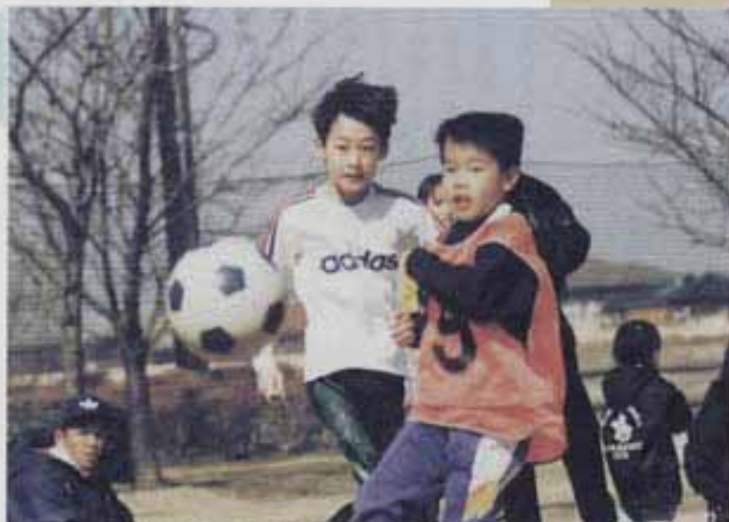
△2月23日 白水大池公園多目的広場「チビっ子サッカー大会」