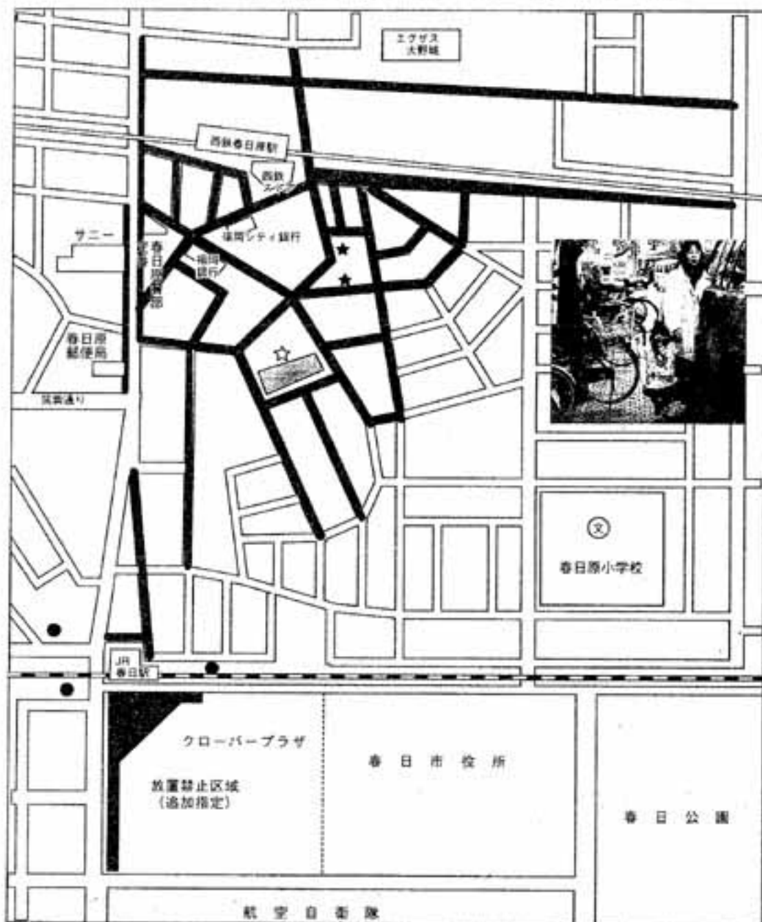
自転車放置禁止区域図