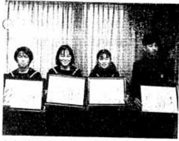
▽春日中学校の受賞者の皆さん