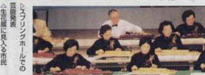
△スプリングホールでの 芸能発表 △生花展に見入る市民

10月31日から11月3日まで、第25回春日市文化祭が、ふれあい文化センターや市民スポーツセンターなどを会場にして開かれました。 今年、市文化協会創立20周年の記念行事もあわせて行われ、大勢の市民でにぎわいました。