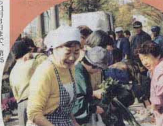
△訪れた市民でにぎわうバザー