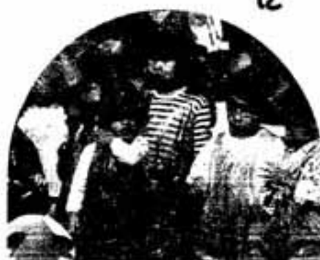
△須玖保育所収穫祭(ハロウィン)から