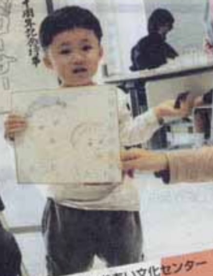
△11月1日ふれあい文化センター (文化祭会場)