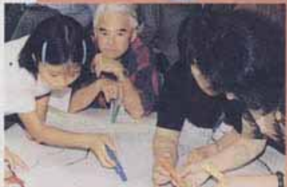
△みんなで意見を出し合って

9月27日、市役所で市民約60人が参加して「まちづくり市民ワークショップ」が行われ、市の魅力や問題点を語り合いました。このワークショップは、市が現在進めている「都市計画マスタープラン」づくりに多くの市民の意見を反映させるために、8月の「中学生まちづくりフォーラム」に次いで行われたもの。ワークショップを終えた参加者からは「参加してみて市の良い点や悪い点がよくわかった」との声が聞かれました。なお、市では今後も地域ごとのワークショップなどを行っていく予定です。詳しくは、市報11月15日号でお知らせします。