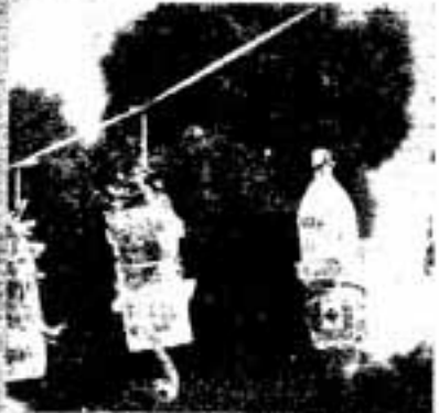
△ペットボトルで万国旗