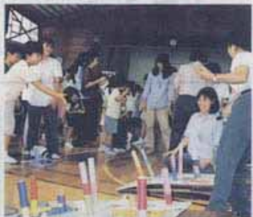
△体育館でのゲームコーナーも大盛況

10月3日、春日南小学校でわくわくカーニバルが行われました。この催しは、学校と地域のふれあいを目指し、「校区ぐるみの祭りにしよう」と始めたもので、今年で2回目。この日、学校では「ノーかばんデー(かばんを持って来なくていい日)」とし、子どもたちは朝から手ぶらで登校。午前中の学芸発表会の後、いよいよカーニバル。パズルやゲームコーナー、特設ステージで繰り広げられる演芸発表と、学校中が子どもたちや地域の人で大にぎわい。参加者たちは、みんなニコニコ笑顔の楽しいひとときを過ごしました。広報レポーター 浦 晃榮