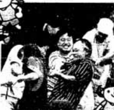
△保護者もパワー全開!