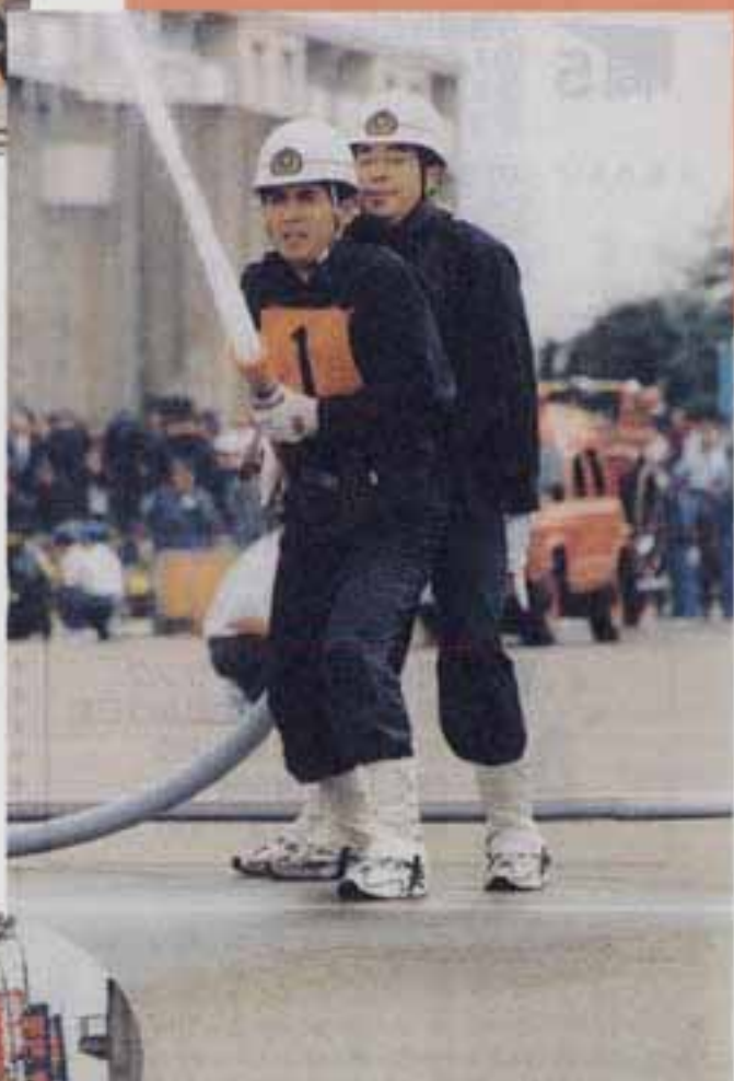
△標的めがけて放水する1番員と指揮者 ◁出場した各消防団ののぼり