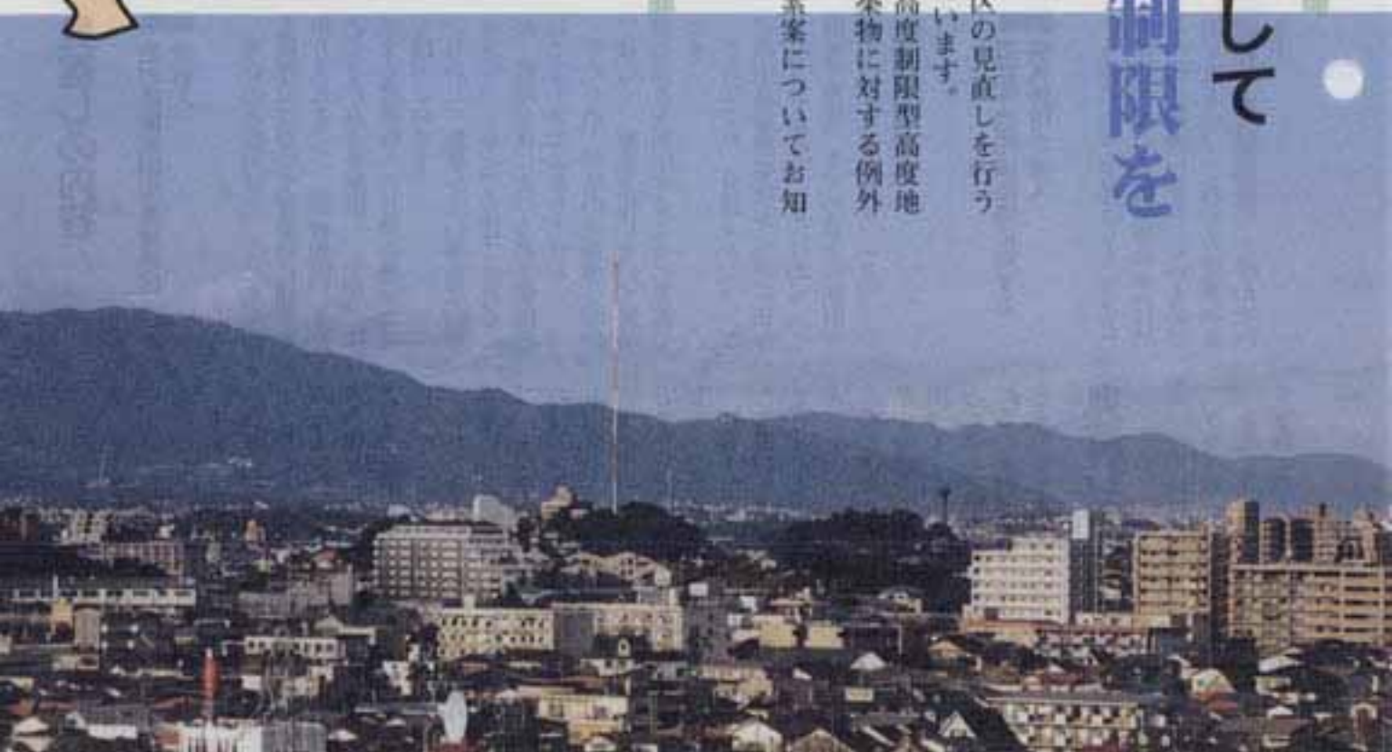
「市役所から西側を望んだ市街地の状況」

市では、来年3月に高度地区の見直しを行う予定で、現在その作業を進めています。見直しの主な内容は「絶対高度制限型高度地区の導入」と「既存不適格建築物に対する例外許可の導入」です。今回は、高度地区見直しの素案についてお知らせします。