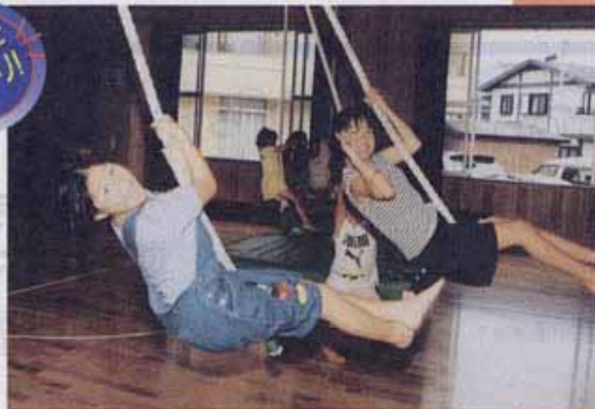
モデルさんには、 写真をさしあげます。