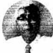
黒越 文英 相談員