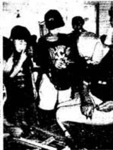
△お年寄りの巧みな技に見入る子どもたち

子どもたちの危なっかしい手つきを見兼ねたお年寄りが、手をとって小刀の使い方を教える場面も見られました。ようやく竹とんぼや紙鉄砲が完成すると、子どもたちは「特にとんぼの両側のバランスをとるのが難しかった」などと話しながらかつて、さっそく部屋を飛び出し、試し撃ちしたりしていました。