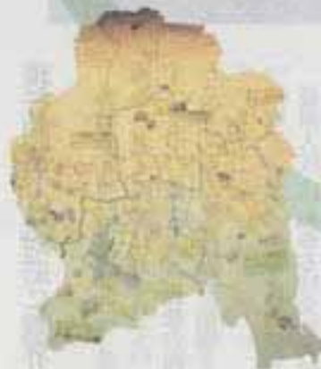
△春日市の未来はこれだ！