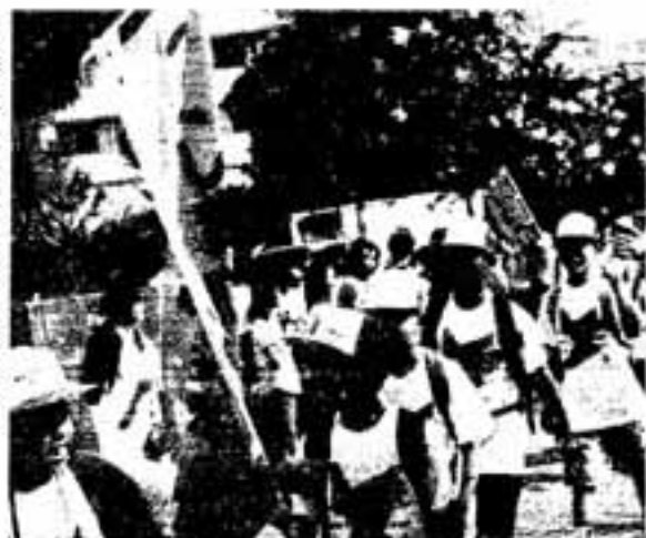
▷保護者らに見送られ、元氣に出発

節水を呼びかけるとともに、慢性的な水不足に悩む福岡都市圏の水事情への理解と協力を求めました。