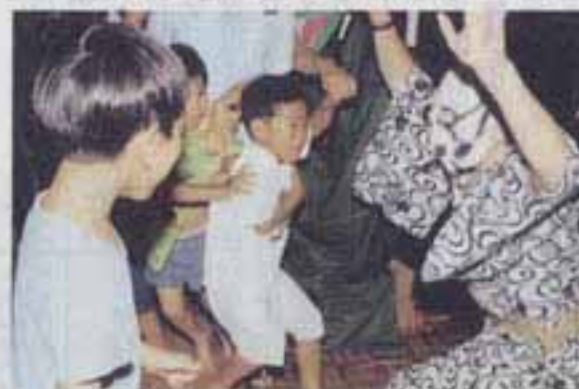
△ぎゃあ~~~~~ | |

7月30日、須玖児童センターにおぼけ屋敷が出現しました。明るい遊び場の児童センターも、この日はばかりは黒いビニールをはりめぐらせてまっ暗に。普段は優しい指導員やボランティアが恐ろしいおばけに変身です。