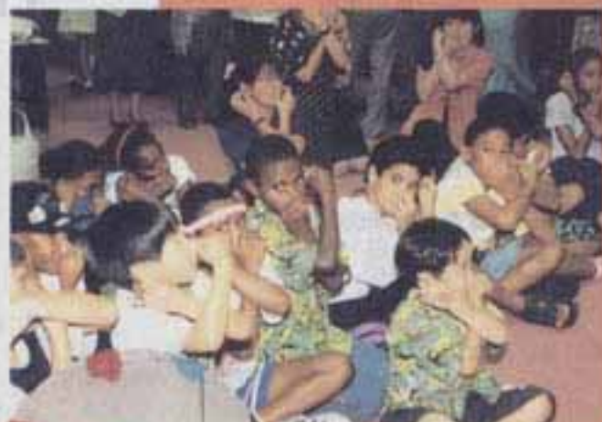
△ホストファミリーの子どもたちと一緒にゲームを楽しむ各国の子ども大使たち