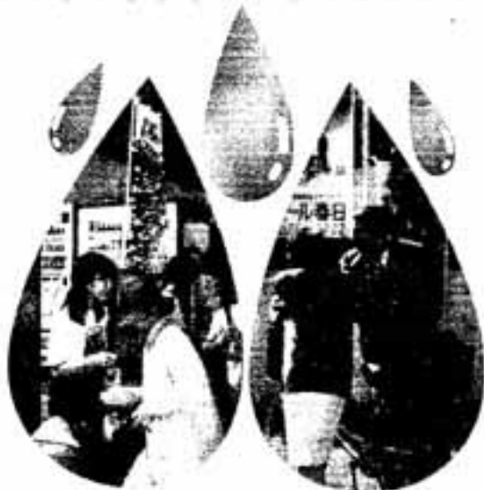
△節水を呼びかける白水市長ら