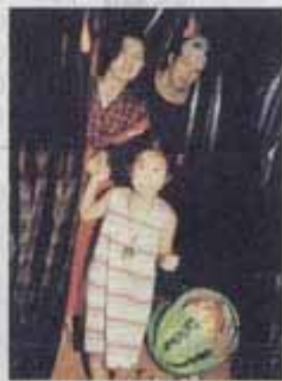
△おばけさん、出て来ないでネ

暑い夏の日、恐怖のあまり気持ちひんやり。子どもたちの絶叫がこだまして、おぼけ屋敷は大盛況でした。