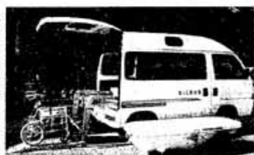
▷福祉の向上に役立っています

市では、自治総合センターが行う平成10年度コミュニティ助成事業の助成金で、福祉車両、車イス、訪問入浴用の分割式浴槽を購入しました。