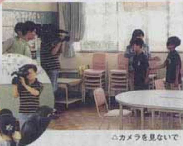
△カメラを見ないで