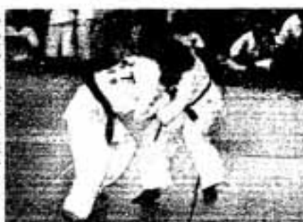
▷必死に組み合う選手たち

7月5日、市民スポーツセンターで春日柔道育成会創立25周年記念大会が開かれました。