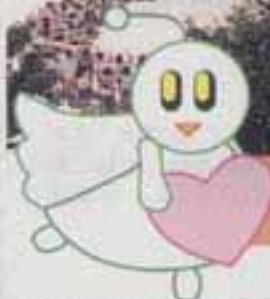
△マスコットキャラクター「キタッピー」 (大塚美乃里さん(中1)と巖斗くん(小4) 姉弟の作品)