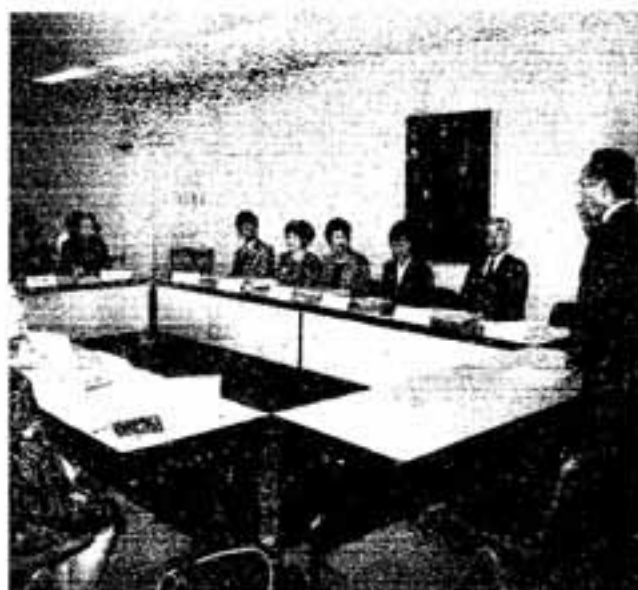
△男女共生の推進を目指して