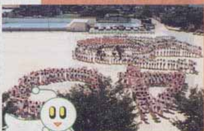
△グラウンドに浮かびあがる人文字