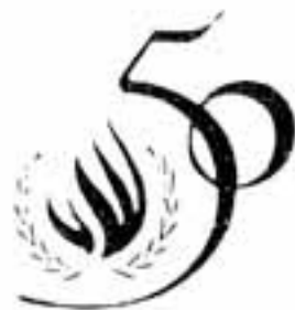
世界人権宣言50周年記念の国連ロゴマーク

あなたは、「差別」に対し無意識に同調したり、無関心でいたりしていませんか。日ごろから「相手の立場」に立つて考えてみることを心がけるとともに、差別しない、差別させない、差別を許さない明るいまちづくりに努めましょう。