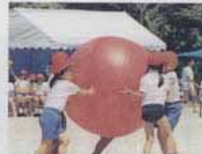
△力をあわせて大玉はこび

また、リレー競走では、走る選手だけでなく、見ている子どもや保護者の顔も真剣そのもの。大きな声で応援しながら、グラウンドに熱い視線を送っていました。