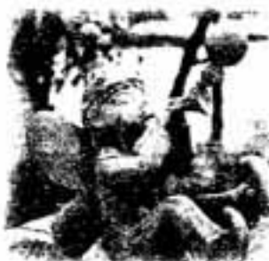
出演 新谷のり子さん 写真ハネル展