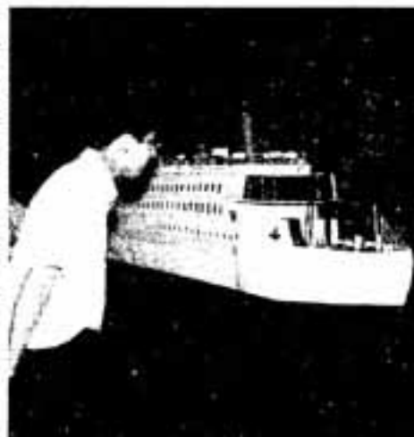
▷見事な出来ばえのタイタニック号

6月7日、県立春日高校で文化祭が開かれ、生徒の家族や地域住民などにぎわいました。