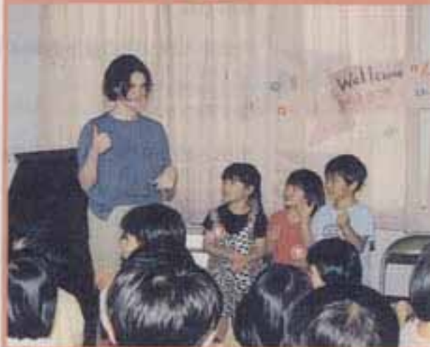
△リズムに合わせて、楽しく手あそび

子どもたちは「ローラお姉ちゃんと遊んでとても楽しかった」とうれしそうに話していました。