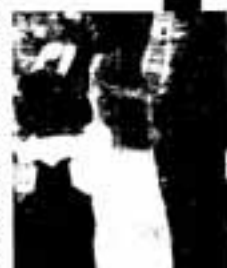
市民大会では、子どもたちが安心して暮らせる社会を築くためには、家庭、地域、学校がどうあるべきかを考えます。

昨年の福岡県下で捕縛された刑法犯少年は10、186人でした。前年と比べ7.1%（676人）増加し、8年ぶりに1万人を超え