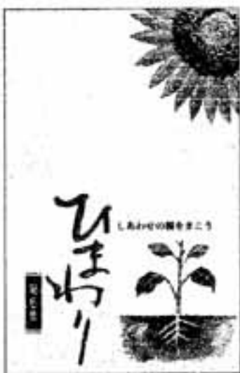
▲3月に発行した同和問題啓発冊子「ひまわり」第6集。この冊子は、平成10年度同和問題に関する啓発広聴コンクール（県などが主催）で、最高賞の特選になりました。