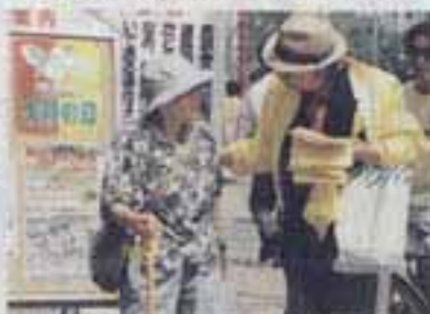
△この運動について説明するボランティア

この日は幸せの黄色いハンカチ普及実行委員会や、市内で活動するボランティア連絡協議会を中心としたボランティアの皆さんが、運動を紹介するチラシと黄色いハンカチを配布し、協力を呼びかけていました。