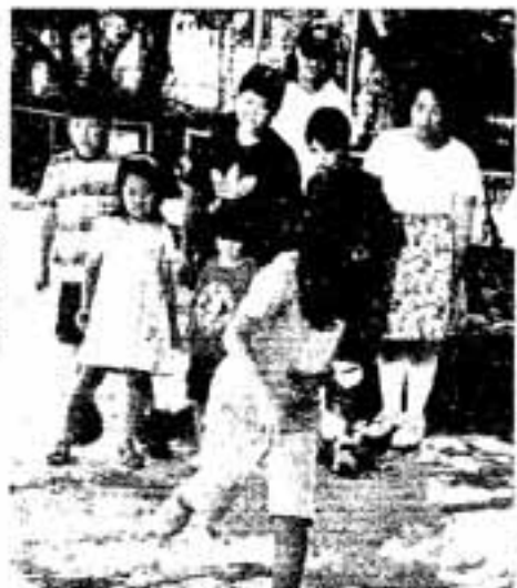
▷石けり役けてケン、ケン、バ

室内で遊んだあとは、外に出て石けりに挑戦。上級生が下級生にルールを説明してあげたりと、みんな仲良く楽しそうに遊んでいました。