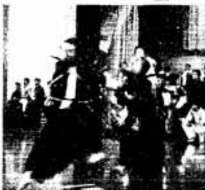
△気合いとともに飛び込む