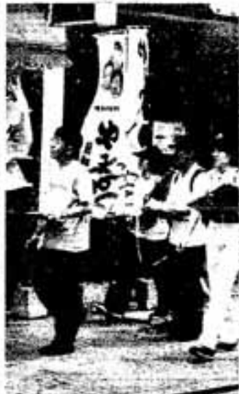
△メモをとりながらウォッチングする市職員

春日市のこれからのまちづくりについて研究する市職員のグループ48人が、5月23日、まち並みウォッチングを行いました。 市は、まちづくりの多くの市民の意見を生かすため、市民に直接参加してもらって話しあう「ワークショップ」を開催し、そのなかで、まち並みウォッチングなども取り入れることにしています。 今回は、9月以降に予定されているワークショップの事前学習として、実際に自分たちでまちを歩いて見て回ったもの。