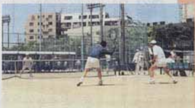
△市民スポーツセンターでの男子ダブルス戦