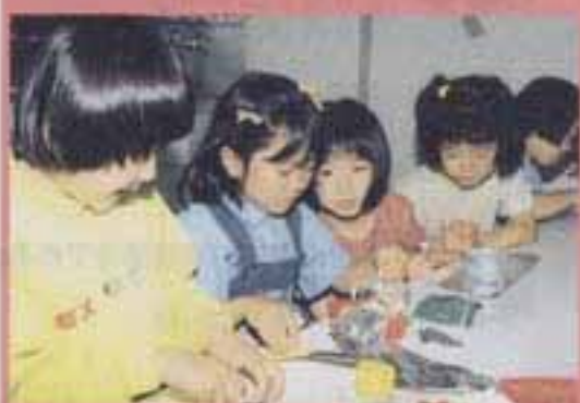
△真剣な表情のこどもたち。

最後は、こころを込めてカードにメッセージを書いて、母の日のプレゼントができあがりました。