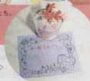
こんなにきれいに できました。

第23回春日市会長杯テニス大会が、4月26日、市民スポーツセンターや若葉台コート会場にして行われました。