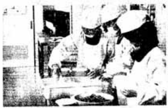
△ホカホカのこはんです

4月10日、春日東小学校を麻生県知事、白水市長らが訪れ、4年4組の子どもたちと一緒に県産米「夢つくし」の給食を食べました。 「夢つくし」は、新学期から学校給食に導入されたばかり。「やわらかくておいしい」「福岡の自慢が増えた」と、子どもたちの評判もなかなかの様子。 この日の献立は白身魚の天ぷらやブロッコリーのソテーなど。県知事や市長と一緒に給食に、始めは緊張していた子どもたちも、食事をするうちにすっかり打ち解けて、楽しく話をしながら、全部残さずペロリと食べてくっていました。