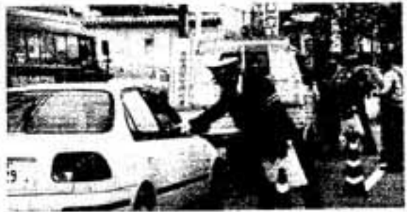
△「安全運転」お願いします

春日市は、春の全国交通安全運動の一環として、4月14日、春日横断通りの宝町2丁目付近でドライバーを対象に、交通安全の路上講習を行いました。 この日は、筑紫野警察署員や市交通安全指導員が、通行中の乗用車やトラックの運転手に、チラシや啓発物品を配りました。 突然止められて、何事かと驚いていた運転手も「シートベルトを忘れずに」「事故には十分気をつけて」と、こやかに呼びかける指導員に笑顔で応じていました。 なお、春日市は、日ごろの交通安全に対する地道な取り組みの成果で、今年3月に、交通事故死ゼロ120日を達成し、県知事より表彰を受けたところです。