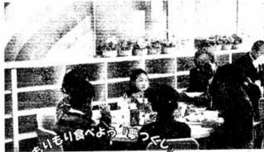
△市長と食へる給食にちよつと笑顔