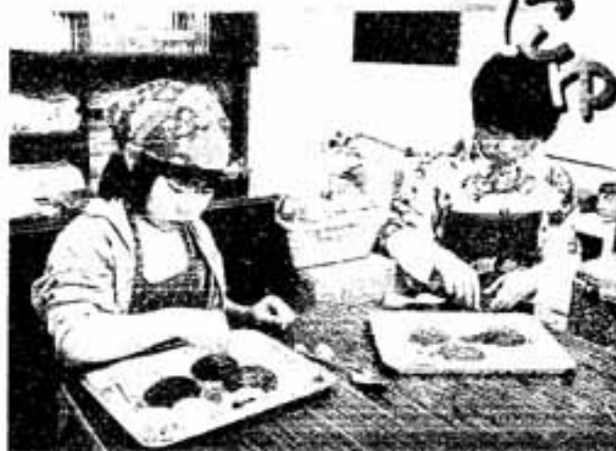
△チョコレートを固まらないうちに、急いで飾り付けしなきゃ

2月7日、若葉台西公民館で、荒町児童館主催の移動児童館「バレンタインデーチョコづくり」が行われました。 参加した子どもたち約20人は、指導員から説明を受けたあと、チョコレートを固まらないうちに、さまざまな色のチョコチップで花や顔など思い思いの飾り付けをしていました。 飾り付けが終わると冷蔵庫で