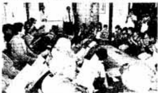
△演奏に合わせて歌うお年寄りたち

子どもたちが「皆さん元気で長生きしてください。演奏を聞いてくれてありがとうございます」とあいさつすると、お年寄りたちからたくさんの拍手が送られていました。