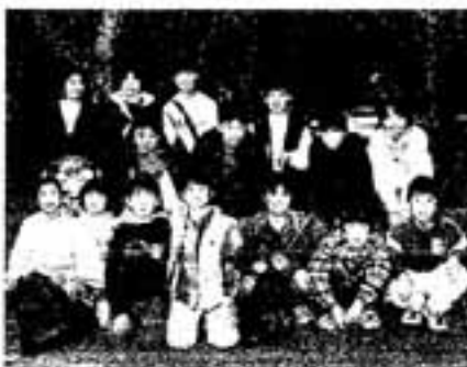
△この日参加したのは16人