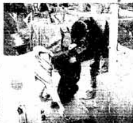
春日西小学校6年3組の子どもたち

子どもたちは表彰を喜びながらも、「拾っても拾ってもゴミが落ちています。ゴミを捨てないようにしてほしいです」と訴えていました。