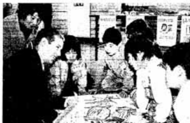
△留学生の話に聞き入る子どもたち

2月5日、春日東小学校で国際理解教育のための研究大会が開かれ、たくさんの外国人が同校を訪れました。 この研究大会は、外国人留学生と祭りや遊びなどについて紹介し合いながら、子どもたちにお互いの国の文化を理解してもらおうと行われたものです。 各学年から一クラスずつの子どもたちが、それぞれ決められたテーマで県内の高校や大学に留学している外国人と交流しました。 祭りがテーマの授業では、まず子どもたちが、写真やビデオを使って「春日の婚押し」を紹介。留学生たちも、上手な日本語で自分の国の祭りについて熱心に説明していました。 終了後、参加した子どもたちは、「外国人と話したのは初めて。ぜひ、また来てほしい」と別れを惜しんでいました。