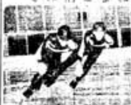
コーナーを攻める二人

浩司さんも、「目標は兄です。目下、次の全日本ジュニア選手権で上位をねらっています」と、これからの活躍が楽しみな二人です。