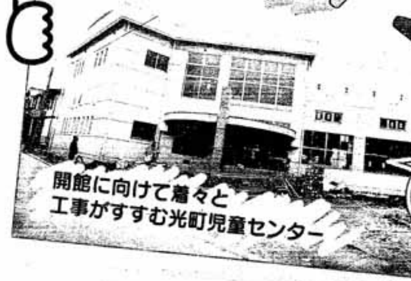
開館に向けて着々と 工事がすすむ光町児童センター