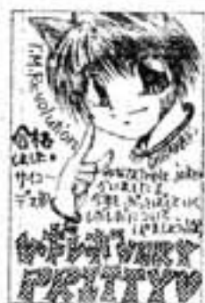
▲P・N 聖渡花 地球