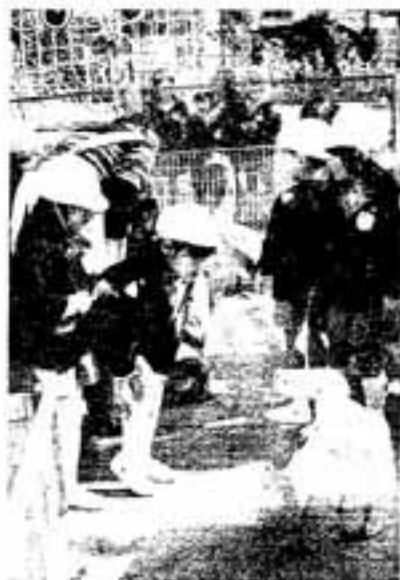
△ガチョウと目が合っちゃった

2月16日、須玖北の須玖幼稚園に移動動物園がやってきました。 この催しは、日ごろ動物とふれあう機会の少ない子どもたちのために、もっと動物に親しんでもらおうと近くの牧場から来てもらったものです。 子どもが好きなねこや子犬のほか、ヤギやガチョウなどの約10種類の動物が園庭に大集合。 はじめのうちは、近寄ってくるヤギや、ガーガーと大声で鳴くガチョウに、子どもたちはびっくり。歓声