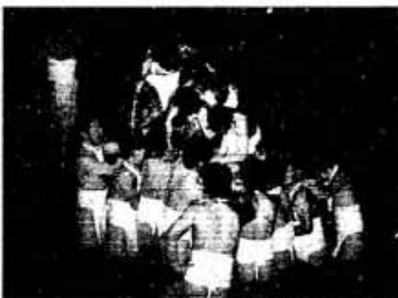
△池の中で荒々しく樽を奪い合う男たち

春日の春日神社で、1月14日の夜、前年中に結婚した新郎新婦を祝う伝統行事「春日の婿押し」が行われました。 この行事は、新郎が若水を浴びせられて祝福されることから「若水祭」とも呼ばれ、国の重要無形民俗文化財に指定されています。 境内で新郎新婦を披露する一連の神事が行われた後、新郎を交えた50人ほどの締め込み姿の男たちが、神社前の池に飛び込んで「婿せり」を始めると、祭りも最高潮。 激しくぶつかり合い、もみ合いながら、割られた樽の破片を奪い合う勇壮な光景に、池を取り巻く大勢の見物客は圧倒された様子で見守っていました。