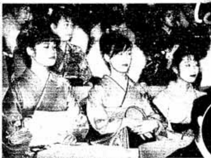
△式典に参加する新成人たち

今年、市内で大人の仲間入りをしたのは1437人。会場には華やかな着物や真新しいスーツを着た新成人が参列しました。主催者らの祝辞にこたえて、