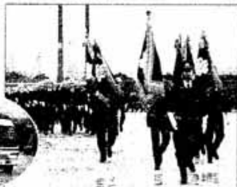
△整然と入場行進する消防団

また、消防署に昨年配備された高規格救急車の展示も行われ、搬送中に車内で医療行為ができるというこの車に観客の関心が集まっています。