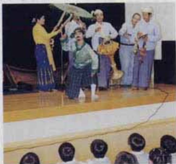
△演奏に合わせてこっけいな踊りを披露

子どもたちは、初めて見るミャンマーの立て琴や太鼓の演奏に神妙な顔つきで聞き入っていましたが、こっけいな踊りが始まると声をあげて大喜びしていました。