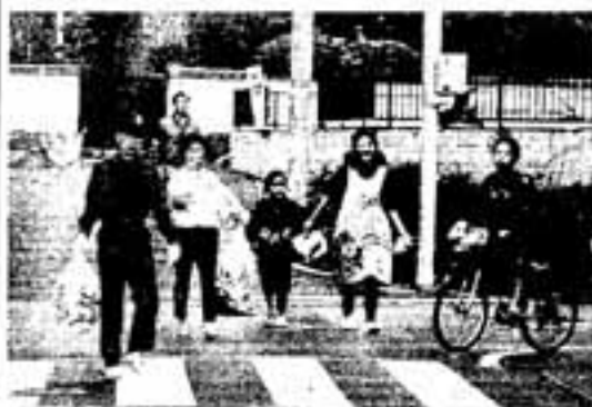
一市生活環境組合連合会

クリーン作戦は、毎年春と秋の2回行われます。これは各町内を美しくするだけでなく、空き缶・空きビンを拾うことで、「ポイ捨て防止」など市民一人ひとりのマナーアップを目指しています。 回収された空き缶・空きビンは、大切な資源としてリサイクルされます。 今回は、11月21日(日)に各自治会長を中心として、一斉に繰り広げられます。美しい町をつくるために、家族そろってクリーン作戦に参加しましょう。