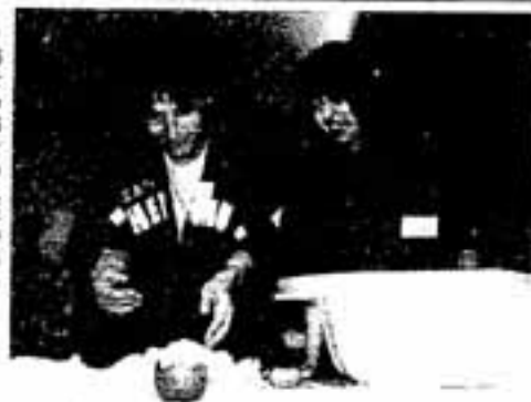
♪おそろおそろ人形の赤ちゃんに挑むパパ

教室終了後は、先輩パパママとの交流会も行われ、実際に赤ちゃんを抱かしてもらうなど、子育ての予習をしていました。