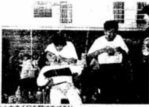
△大きく口を開けてバクリ

10月3日、春日小学校体育館で、第15回春日市障害者(児)大運動会が行われ、約200人の市民が参加しました。 中国の服を着た市体育指導員が「カンフー体操」を披露。みんなと一緒に体をほぐした後、競技開始。パン食い競争では、ひらに下げられたあんパンを大きな口を開けてバクリ。用意した100個のパンを全部食べつくしました。 このほかにも、車イス競争、ピ