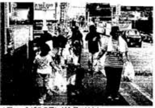
△アッ、たばこの吸い殻が見つけた!

秋のクリーン作戦に先立って、9月25日、須玖保育所の子どもたちが、保護者と一緒にまちの清掃に繰り出しました。 子どもたちに、身近な環境をきれいにすることの大切さを教えるために毎年行っているもの。 それぞれ背中や胸に「たばこやあきカンのポイ捨てやめよう」などと書かれたゼッケンをつけ、ゴミ袋を持って保育所近くの道路にポイ捨てされたゴミを拾って回りました。 たった30分ほどで集めた空カ