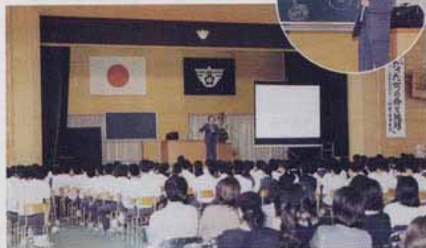
△生徒も保護者も真剣に