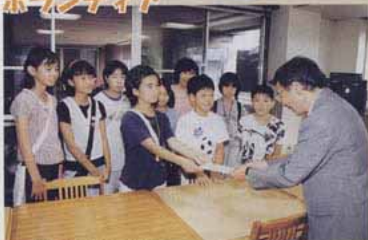
△福祉に役立ててください

応じた社協職員は、熱い思いのこもった寄付に感激しながら「大事に使わせていただきます」とお礼を述べていました。