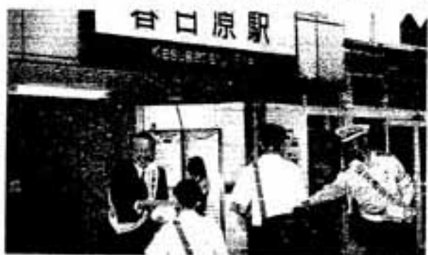
△行つてらっしゃい、気をつけて

秋の交通安全運動期間中の9月27日、井上市長や筑紫野警察署の署員が、西鉄春日原駅前で通勤通学途中の市民に交通安全を呼びかけました。