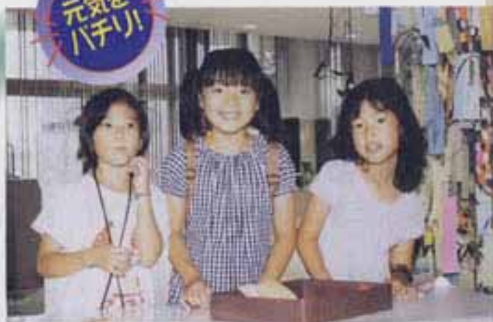
△7月3日 ふれあい文化センター 七夕飾りに願いを込めて