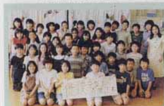
6年2組のみんなで考えたトキの名前です