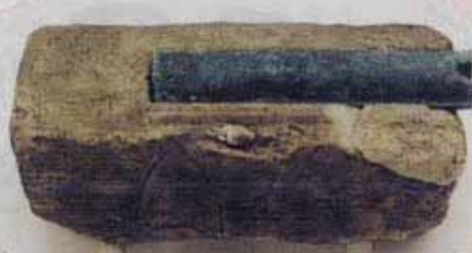
△新宮町から出土した製品とピタタリ一致

須玖坂本遺跡（岡本1-79）から、弥生時代後期の青銅器「筒状銅製品」の石製鑄型と、49個のやしりを同時に生産できる「銅版大量製作」鑄型が全国で初めて出土しました。