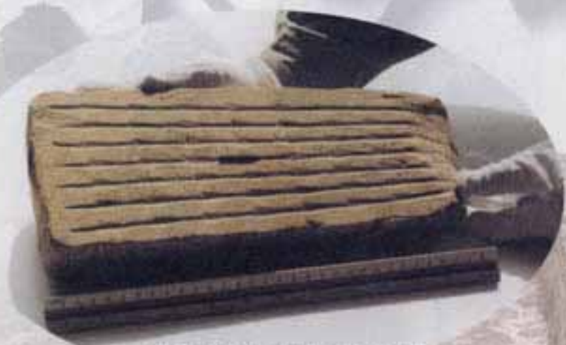
△49個のやしりがまとめてつくれます