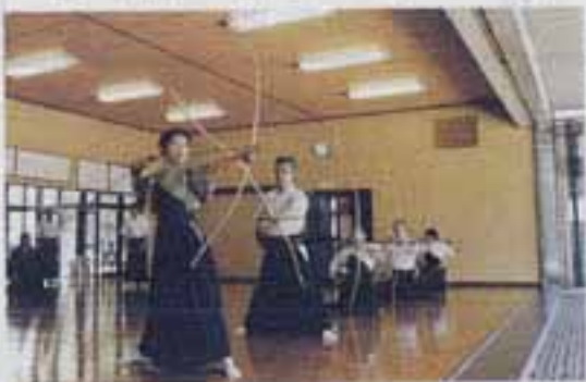
△的をめかけて一心不乱