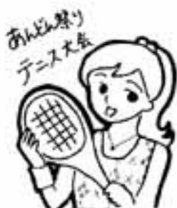
あんどん祭り テニス大会

福岡家事調停協会では、無料の調停相談会を行います。 日時 7月9日(金) 午前10時～午後3時 場所 中央市民センター(福岡市