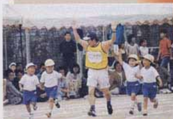
△親子で競技まで盛り出されたふれあい大運動会