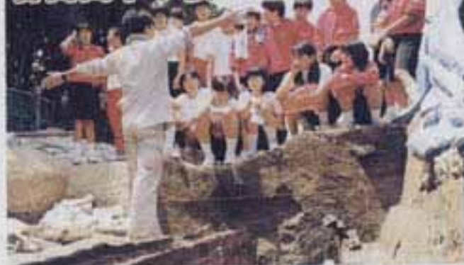
△大土居水城跡で市職員から木桶の説明を受ける生徒たち

6月4日、春日西中学校の2年生295人が、「奴の国再発見ウォークラリー」と題して、「文化財調査活動」を行いました。