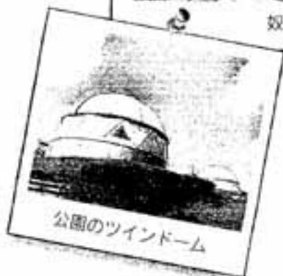
公園のツインドーム