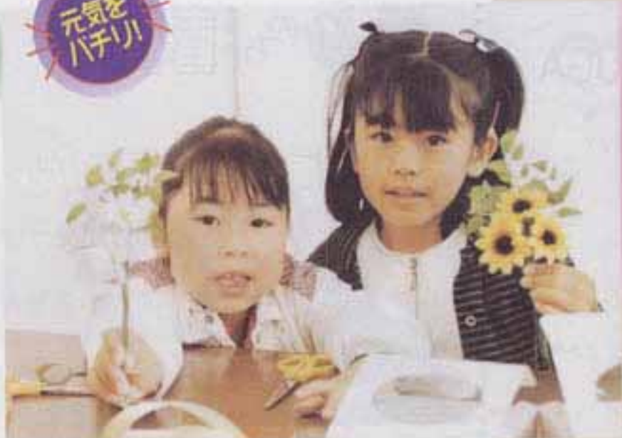
△5月8日 須玖児童センター 母の日のプレゼント作り(コサージュ)