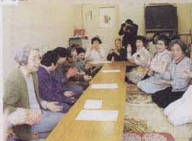
△みんなで楽しく歌います