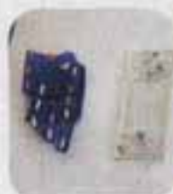
△ビーズできれいに飾りつけ

透明の板ガラスや青いビンなどのかけらを組み合わせ、これを電気炉で焼いてペンダントやはしおきなどをつくるガラス細工教室が、4月10日、光町児童センターで行われました。