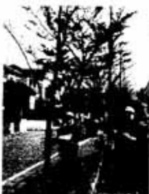
△きれいなまちだね