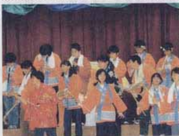
△みんなで心を合わせて劇を演じる6年生

会場の体育館に集まった保護者はもちろん、毎年これを楽しみにしている地域のたくさんのお年寄りから盛んな拍手が送られていました。