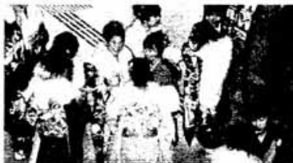
△再会を喜び合う新成人たち

その後は、中学時代のスライド上映や恩師の登壇など、和やかな雰囲気となりました。それでも一番の楽しみは、やはり久しぶりの友人との再会。会場のあちらこちらで、「元気だった?」「変わらないね」などと再会を懐かしむ喜びの声が上がっていました。