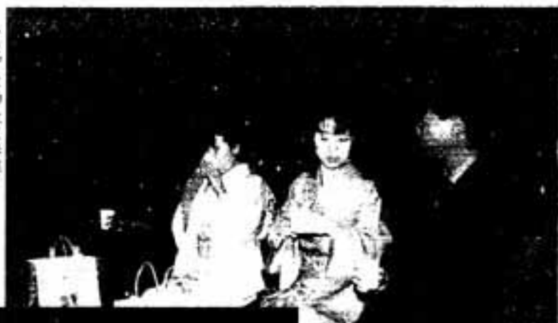
▷まずは神社に参拝