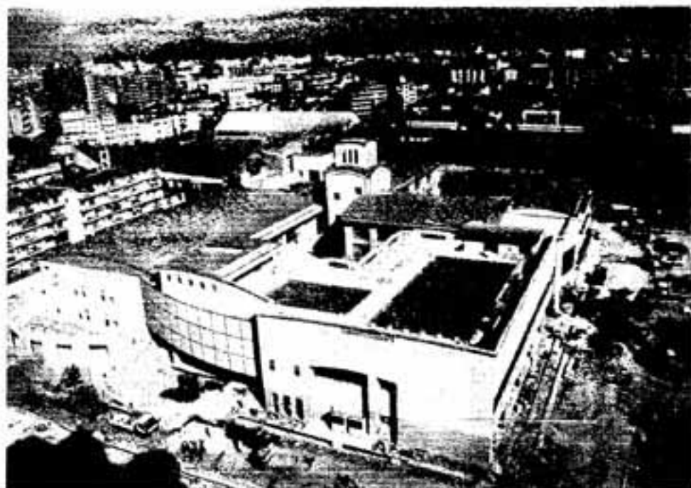
▲4月の開校に向けて着々と工事が進む日の出小学校