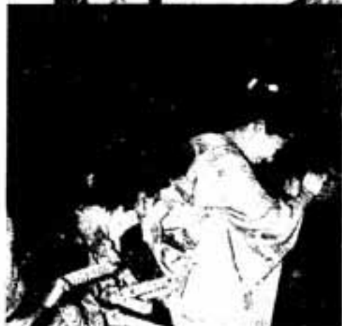
△痛くてもガマン、ガマン

二人は、神社に参拝した後、境内に円すい状に組まれた燃え盛る左義長の周りで、子どもたちから力いっぱい祝福を受けていました。