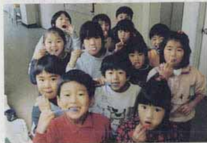
△みんなで歯みがき、楽しいな