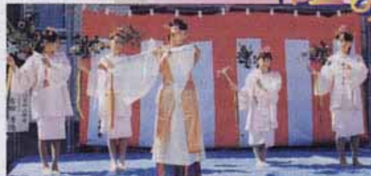
△おびやかな巫女の舞