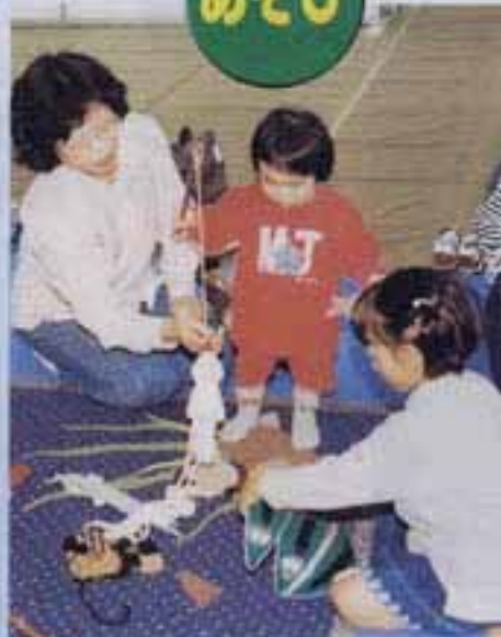
△「わーい、釣れたー」(こども広場)