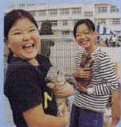
△「キョーがわいがー」(ふれあい動物園)

明るく、元気で、楽しい内容の各コーナーは、親子づれからお年寄りまでとたくさんの人でにぎわいました。