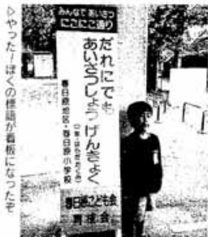
ひやつた！はくの標語が看板になったぞ

10月20日、春日東中学校3年2組の生徒が、NIE授業の発表会を行いました。 NIE (Newspaper In Education) とは、新聞を教材に使い、社会の出来事などについて学ぶこと。 新聞をいろんな角度から見るとしるさを見つめることをテーマに、生徒たちは社会科の授業(計8回)を使い、ダイエーホークスの優勝など身近な話題からパレスチナ問題など難しい題材まで、班ごとにさまざまな題材に取り組みながら、この日の、「オリジナル新聞」の発表を向かえました。