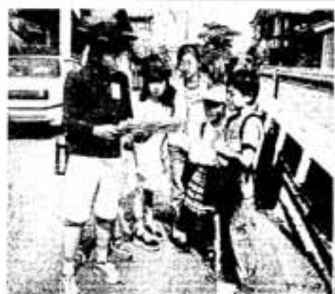
うーん次の道はどつちだ!?