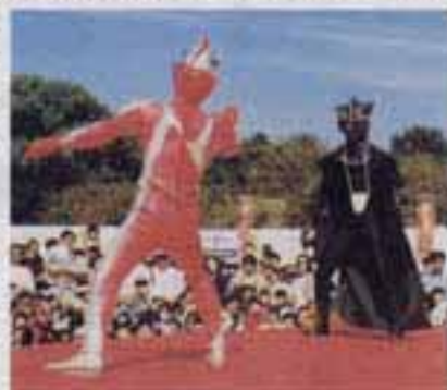
◀ウルトラマン、がんばれー！

主催者は「気持ちのよい秋晴れのおかげもあり、昨年を上回る賑いです」と喜んでいました。