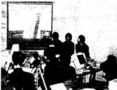
△オリジナル新聞について発表する生徒たち

生徒たちは、日ごろあまり読むこと のなかった新聞と格闘。新聞を学校や 家庭で何度も読み返したり、スクラッ プしたりと苦勞した様子。 この授業をきっかけに、新聞を毎日 読むようになった生徒もたくさんいる ようで、同じニュースでも新聞によっ て書き方がちがうことや、新聞を通し て社会を知ることの大切さなどを学び とっていたようです。