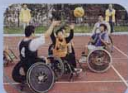
△ほくも車イスバスケットに挑戦

10月22日、いきいきプラザ、春日小学校、福祉ばれっと館を会場に「いきいきフェスタ春日2000」が行われました。