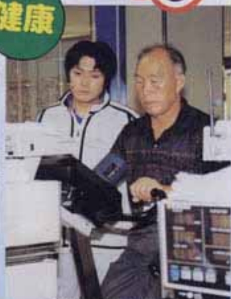
△自転車こぎによる健康度測定