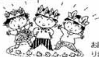
お話の主人公になりました

絵本を読んでもらっている時の子どもたちの顔の輝き。子どもは知に入れば、心ばかりが体ごと絵本の世界に引き込まれてしまいます。お話の世界を想像体験しながら、想像力ややさしさ、思いやりの心が育っていきます。秋の夜更け、お布団の中で聞くお母さんやお父さんの声は、子どもたちを夢の世界へと誘ってくれることでしょう。