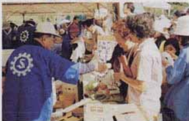
△商工会による野菜の大安売り。あっという間に売り切れ

10月15日、泉宮春日公園で、春日市商工まつりが行われ、大勢の人でにぎわいました。