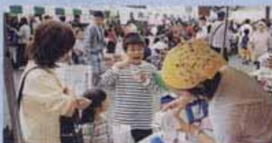
△ふれあいパズルは大にぎわい