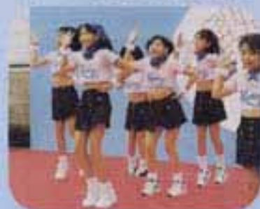
△「ホットキッズ」の元気なダンス