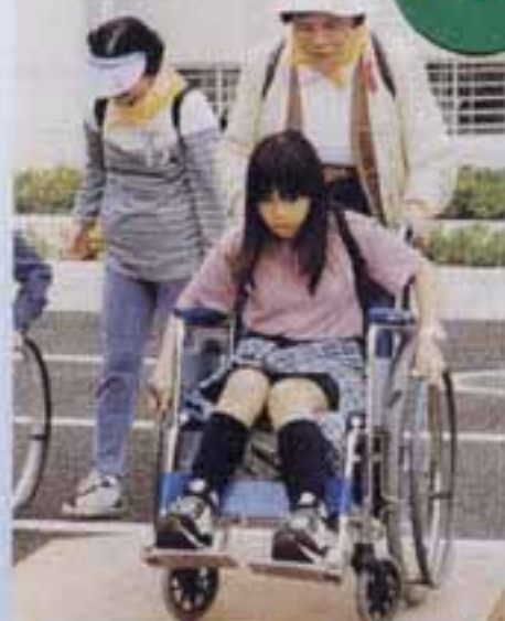
△車イスってこんなに大変なんだー