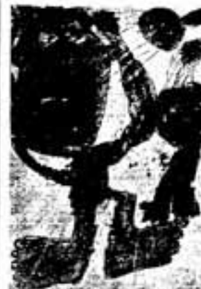
△前回の弥生の里大賞作品 (テーマ「パワー全開」)