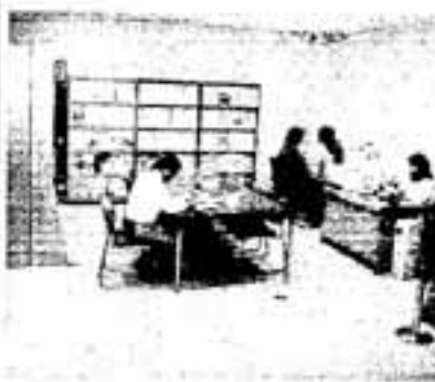
△「情報公開コーナー」もさらに充実