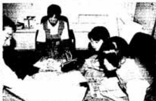
△担当者の説明に真剣に聞き入る生徒たち

7月6日、春日東中学校の生徒 約131人が、総合学習のために 市役所を訪れました。