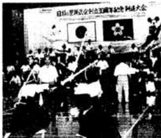
△一編のスキをついてメーン