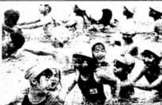
△だいじょうぶ、私の肩につかまって!

富永築園長先生は「園児も、お 兄ちゃん、お姉ちゃんたちに遊ん でもらって大喜び。これからもせ ひ続けていきたい」と話していま した。