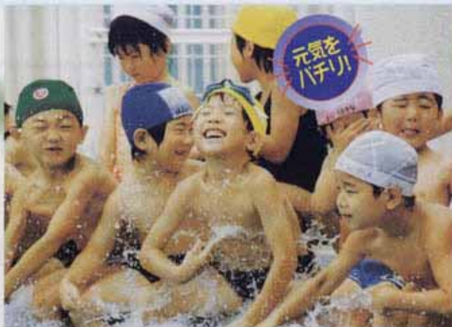
△7月13日 春日北小学校プール「ヒヤッ、冷たい」