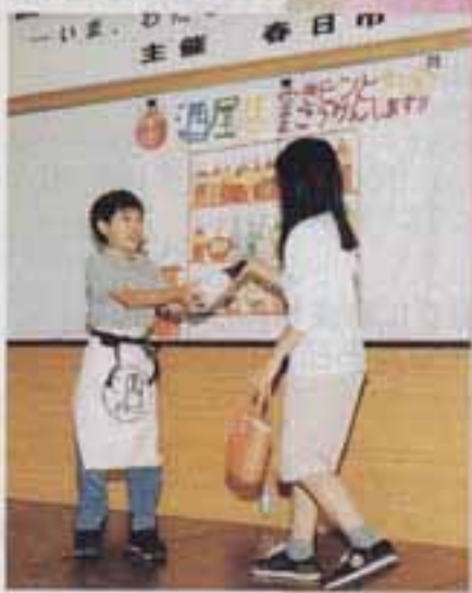
△リサイクルできるビン入りのものしか売らないは

また、大谷小学校5年1組の皆さんによる研究発表も行われました。「環境にやさしいエコショップ」をテーマにしたこの発表では、ラップによる個別包装をしない果物店や、リサイクルできるビン入りのものしか売らない酒店などが登場。説得力のある発表に、観客からは大きな拍手が送られていました。