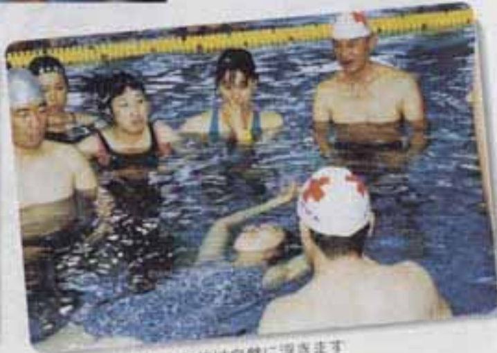
△もともと体は自然に浮きます