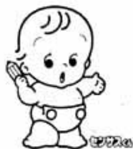
国勢調査のイメージキャラクター