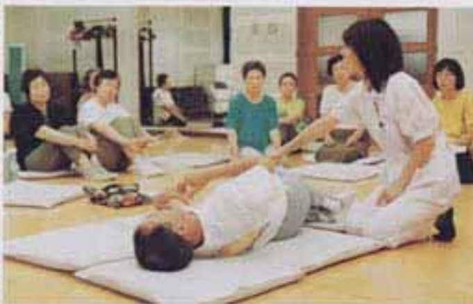
△実際に体の動きを確認しながら

なお、家庭介護教室は、6月30日からは上白水公民館で、9月に日の出町公民館で、10月にはいさいきプラザで行われます。