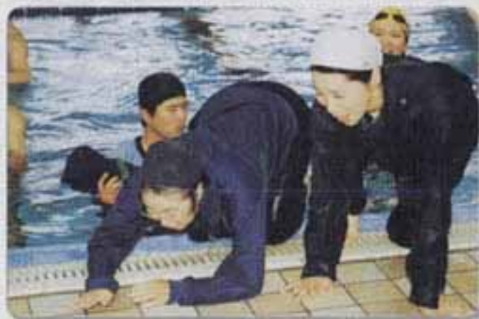
△水から上がる難しさも体験