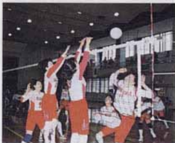
△鋭いアタックを必死でブロック

6月18日、市民スポーツセンターで、第25回一般女子バレーボール大会が行われました。