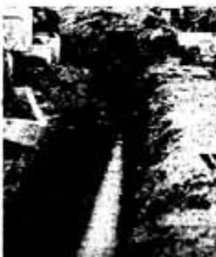
家庭は、早めの水洗化工事をお願いします。(下水道課)

快適な生活環境を守り、さわやかで文化的な暮らしをするためにも、まだ下水道を利用していない