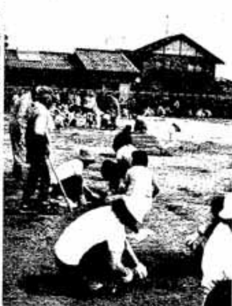
1時間足らずで公園はきれい

住民約100人が集合。全員、くま手や移植ごてを手に、伸び始めた草をせつせと取り除いていました。自治会役員は「早く独り