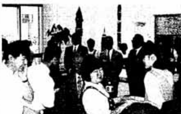
なごやかに交流する参加者

立ちでできるよう地区住民で協力し合って頑張ります。地域活性化のために、このあと、グラウンドゴルフで交流します」と張り切っていました。