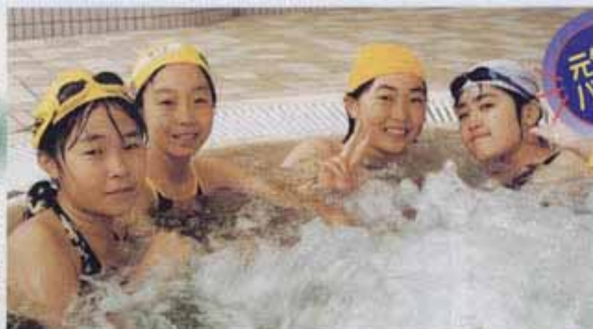
△6月4日 湯水プール(ジャグジー)