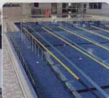
△スロープも付いた温水プール