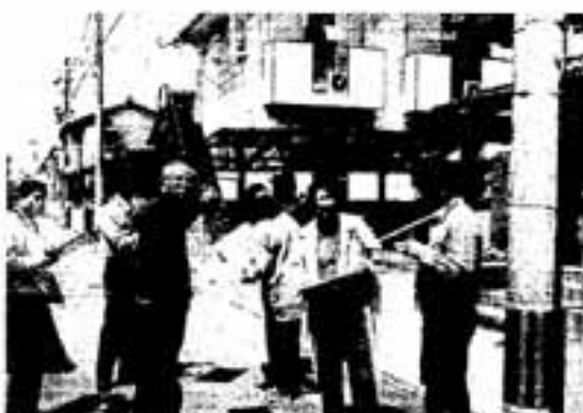
の糸口を見つけていきたい」と話していました。

参加者は、「この地区は消防車も入れない路地も多い。今後、協会の輪を広げながら、課題解決