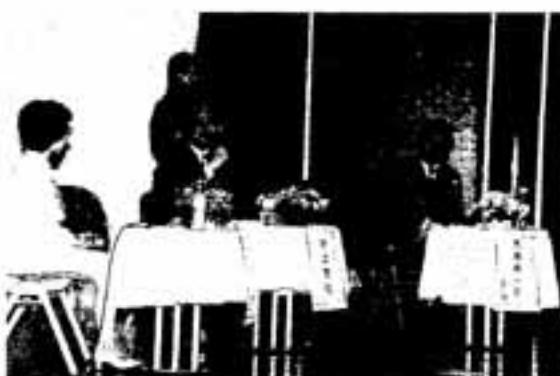
なすいたり、拍手をしたりしながら、真剣に聞き入っていました。