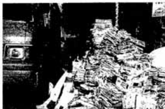
古紙と古布の回収量

美しい地球を守るためにも、さらに、ゴミ減量にご協力ください。新たに古紙などの集団回収を計画している社会教育団体などは相談ください。