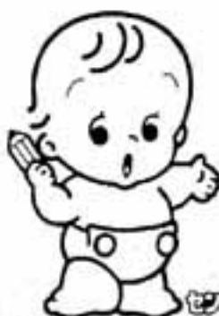
国勢調査のイメージキャラクター