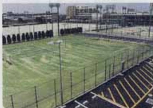
△人工芝テニスコート（3面）

※ これらの施設は、“春日勤労者総合スポーツ施設”として、雇用・能力開発機構の補助を受けて建設されたものです。