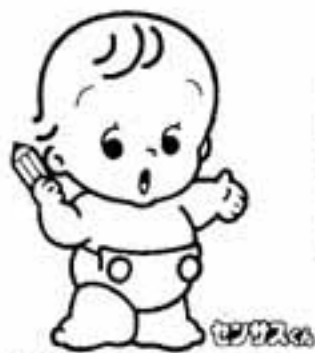
国勢調査のイメージキャラクター