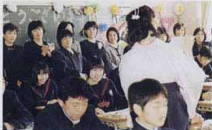
「あたたかい祝福に生徒も保護者も感謝」