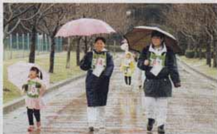
△雨にも負けず、ニコニコペースで

会場には、ぜんざいコーナーなども設けられ、歩き終わった参加者が心地よさそうに汗をふきながら、舌鼓を打っていました。