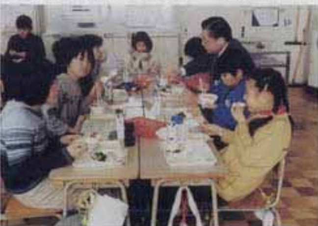
△今日のメニューは「かいせんチャンポン」