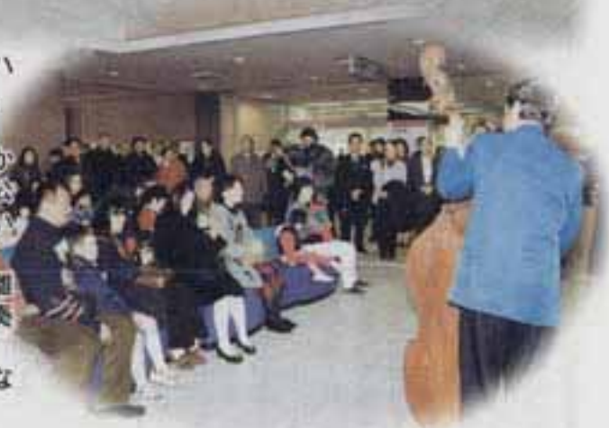
△すばらしい演奏に聴き入る市民

市役所を訪れた人たちは、団員たちの異国情緒豊かな演奏に、しばし足をとめて聞き入っていました。