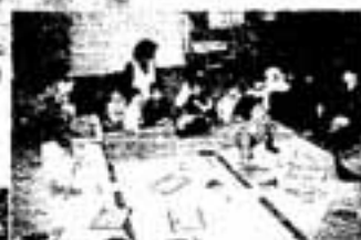
お正月あそびの会