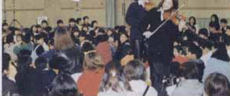
く観客の中で演奏する二人