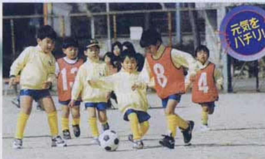
△2月11日 市民スポーツセンター