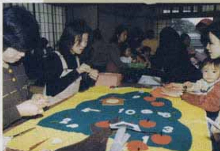
△布でつくるりんごの木には、楽しい仕掛けがいっぱい