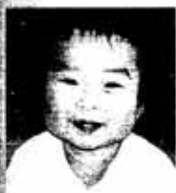
園長 園長さん(園長) 平成11年3月10日生