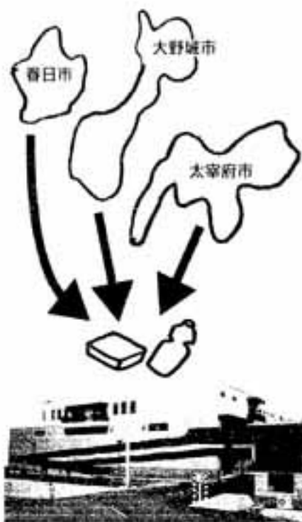
春日大野城リサイクルセンター

リサイクルプラザには、春日市、大野城市、太宰府市の3市で回収されたペットボトルと白色トレイが集まっています。