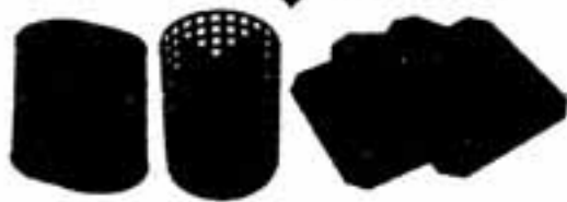
プラスチック製品に生まれ変わります