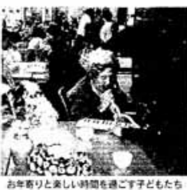
お年寄りと楽しい時間を過ごす子どもたち

そこで、保育所では、市内の小・中学生に遊びに来てもらう「異年齢交流」。また、老人会やデイケアセンターを訪ねたり、逆に高齢者を園の行事に招待したりする「世代間交流」にも努めています。