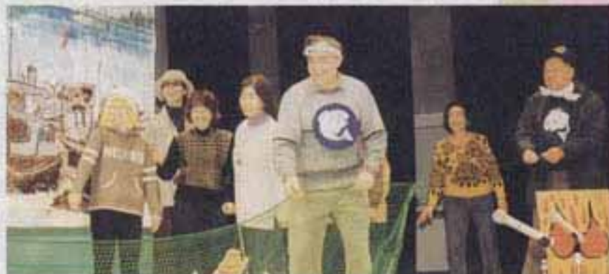
講師と楽しく演技する英会話クラス