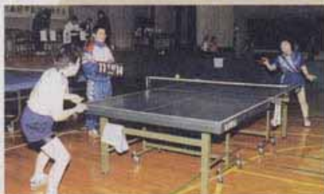
小さな球から目を離さずに