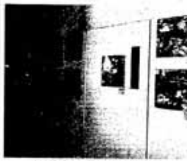
△昨年の展示会の様子

「パワー全開」のテーマで、県内の小学生に募集した「第8回弥 生の里児童画大賞展」の作品展示会を行います。 展示は、弥生の里大賞は約260 点です。ぜひ、子どもたちの力あふれ る作品をご覧ください。 期間 1月23日(日)～2月6日(日) (月曜日休館) 時間 午前10時～午後5時 会場 ふれあい文化センターギャラリー 1(大谷6-24) 問い合わせ先 社会教育課公民館担当 ☎(575) 4121