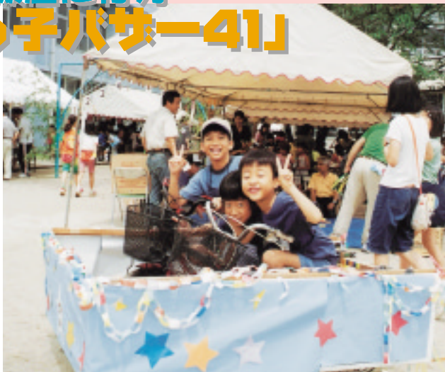
◁ 手作りのなかよし自転車