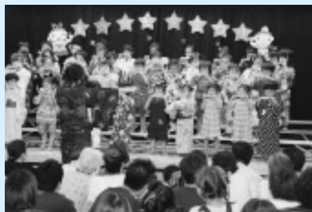
△かわいい浴衣やパジャマ姿の園児たち