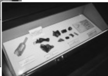
△原爆被災資料 (長崎市)