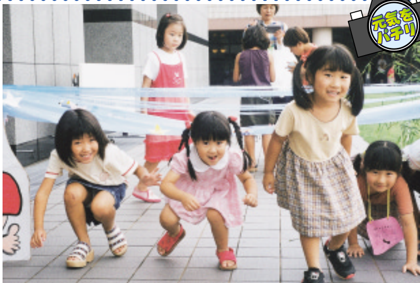
モデルさんには、写真をさしあげます。

市報かすが 発行／春日市役所 編集／春日市役所企画情報課広報担当 印刷／(資)四ヶ所印刷 〒816-8501 福岡県春日市原町3丁目1番地5 ☎092(584)1111 URL http://www.city.kasuga.fukuoka.jp/