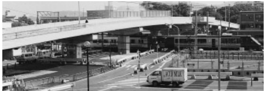
△最後の仕上げにかかる立体交差道路