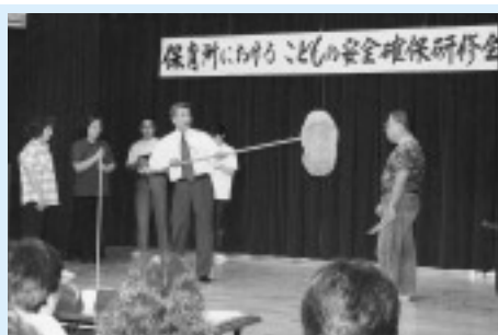
△職員ふんする暴漢を相手に、モップ撃退法を指導する筑紫野警察署員

参加した保育士は、「アドバイスを基に、自分の保育所の施設に合った対策を早急に講じます」と真剣に答えていました。