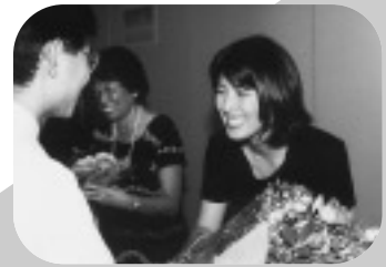
△ケイシー先生、ありがとうございました