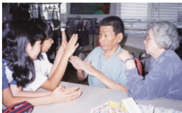
◁ はい、こやち「ムム、これは難しいぞ」