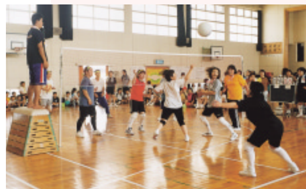
◁ 子どもたちの声援を受けて張り切る大人チーム