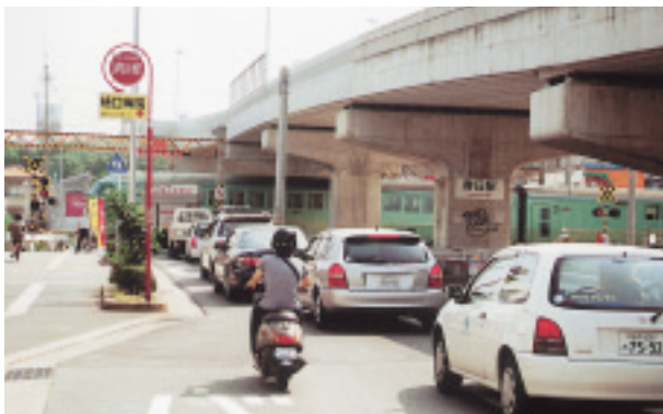
△開通すれば踏切によるこの渋滞も解消されます

平成5年に始まったJR千歳踏切を高架にする「筒井小倉線(春日中央通り)立体交差道路」の工事がまもなく完了し、8月上旬から通行できるようになります。 ※ 開通の日時は、事前に現場周辺に案内板を設置してお知らせします。 (2ページに続く)