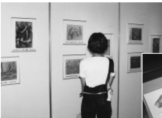
△昨年の原爆被災展