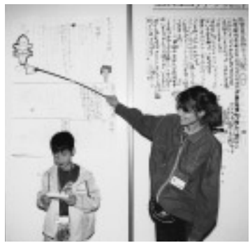
△こどもエコクラブの発表の様子