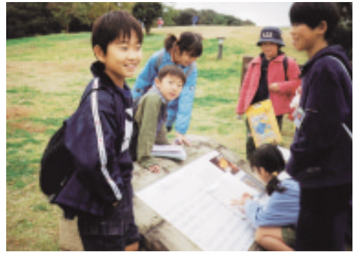
△チームで協力して課題を解く子どもたち