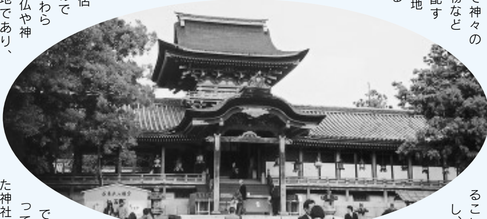
△宇美宮の本社 石清水八幡宮(京都府)

寺社の荘園に同系の神社が置かれたのは、神がたえず領地に存在して、その恩恵で豊作と領民の幸せを願うのを建前に、神の力で他からの侵入を防ぎ、領民が領主である寺社へ反抗しないように見張り、絶えず威圧するためのものだった。領主によって村に勧請された神社にはこのような二面性を持っていました。