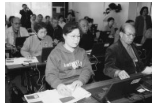
△真剣な表情でマウスを使う練習に励む参加者

初日の今回は、まずパソコンに慣れてもらうため、マウスの使い方の説明があり、参加者は「クリック」や「ダブルクリック」、「ドラッグ」など、簡単そうで意外と難しい操作に苦労していました。