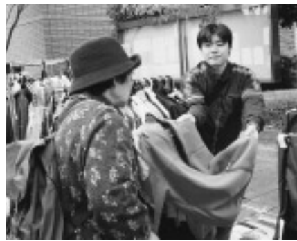
△リサイクル品を熱心に吟味