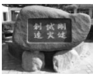
△記念に作られた校訓碑

また同校では、20周年をきっかけに「なんちゅうカレッジ」を発足。これは、教科以外の幅広い知識やマナーなどを生徒と地域住民が一緒になって学ぼうというものです。講師も地域住民らが務めます。国際交流や、陶芸、ウインドサーフィン、マジックなど計22講座が計画されており、今後の発展が楽しみです。