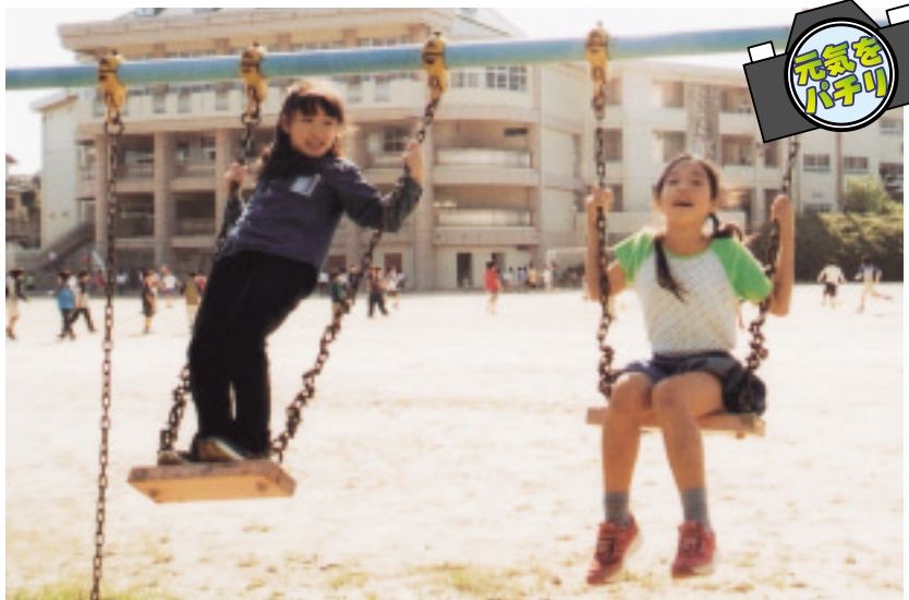
△10月25日、春日東小学校

市報かすが 発行/春日市役所 編集/春日市役所情報政策課広報担当 印刷/(資)四ヶ所印刷 〒816-8501 福岡県春日市原町3丁目1番地5 ☎092(584)1111 URL http://www.city.kasuga.fukuoka.jp/