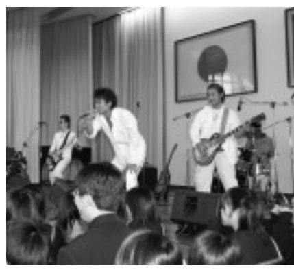
△熱演のゴッド・ブレス