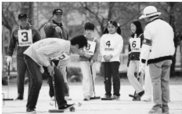
△おじいちゃんに習ってプレーするお父さんも緊張さみ