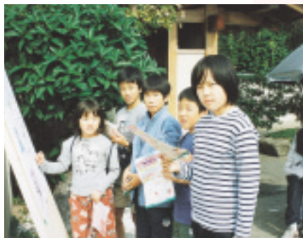
△ウォークラリーで難問に挑む子どもたち

10月26日、春日西小学校で「出逢い・ふれあい・夢物語 in 笑人通り」と題して地区祭りが開かれました。