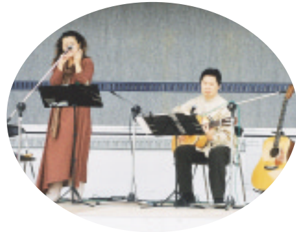
△校庭でのオカリナコンサート