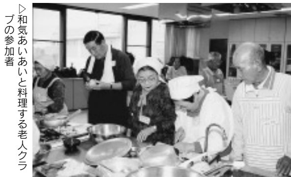
▷和気あいあいと料理する老人クラブの参加者

参加者の一人は、「料理も楽しかったけど、ほかのクラブの人たちと交流できたことが何より。ぜひ、来年も続けてほしい」と満足そうに話していました。