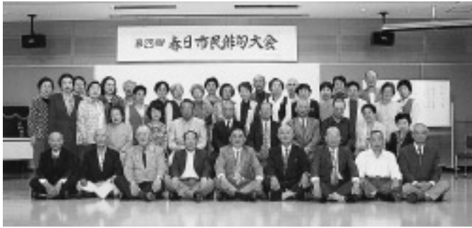
△市民俳句大会参加者の皆さん