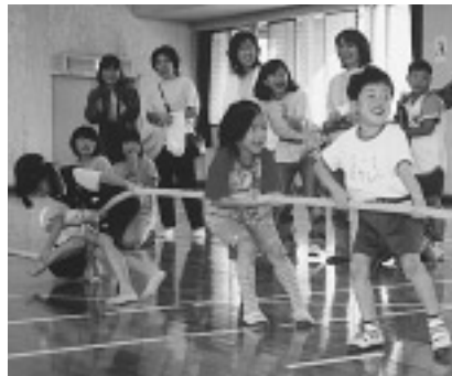
◁地区対抗綱引き ▽ベテランテニス大会

市制20周年を記念して始まったこの大会も、すでに11回目。一晩中降り続いた雨も上がり、地区対抗のドッジボールや少年相撲、ベテランテニス大会やゲートボール大会など白熱したゲームが繰り広げられました。