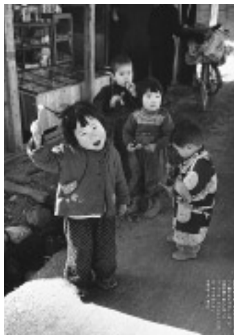
△昭和29年2月 春日町(現春日市)

日程 11月24日(日)～12月8日(日) 場所 ふれあい文化センターギャラリー(大谷6-24) (市制30周年記念事業市民実行委員会)