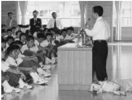
△盲導犬バイロン号とともに