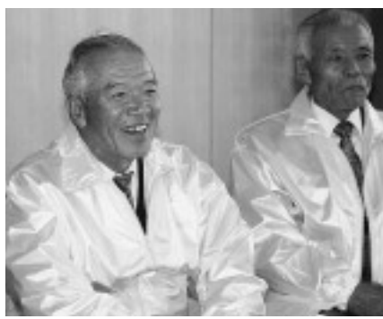
仕事の楽しさを笑顔で報告