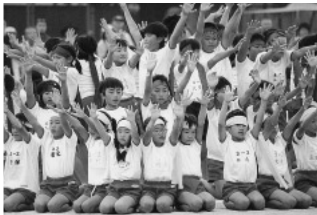
△「ソーレひけ!! ソーラン」で息の合った集団演技