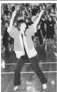
▷スポーツフェスタ開会式で初披露