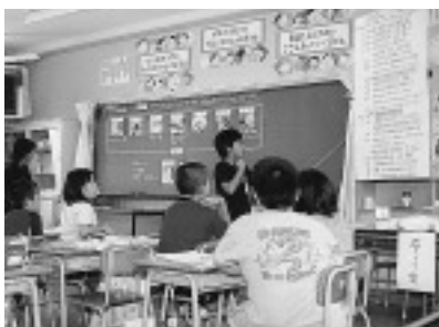
◁博多人形について学んだことをみんなの前で発表