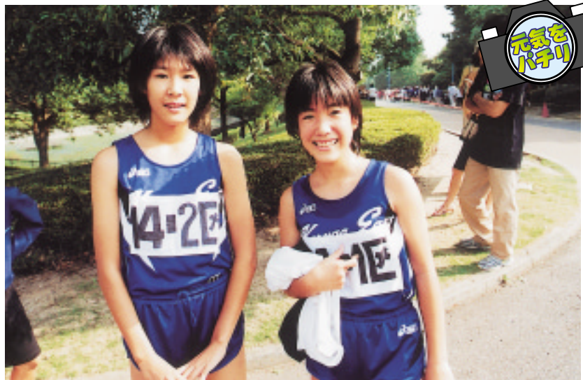
△10月5日、中学駅伝大会(春日公園)