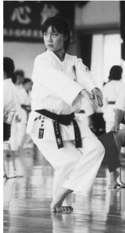
▽形の部で、気迫の伝わってくる演技を披露する出場者