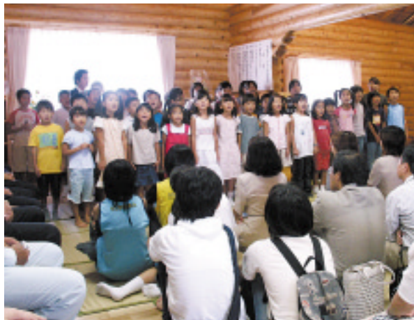
△保護者のみなさんへのお礼に歌を歌う子どもたち

すべての運営を父母で行っているこの放課後児童クラブ。ますます子どもたちが安心して放課後を過ごすことができる場となるでしょう。