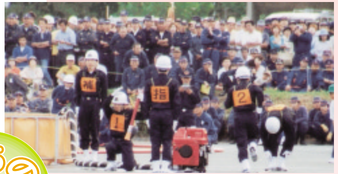
◀大勢の観衆が見守る中緊張の演技