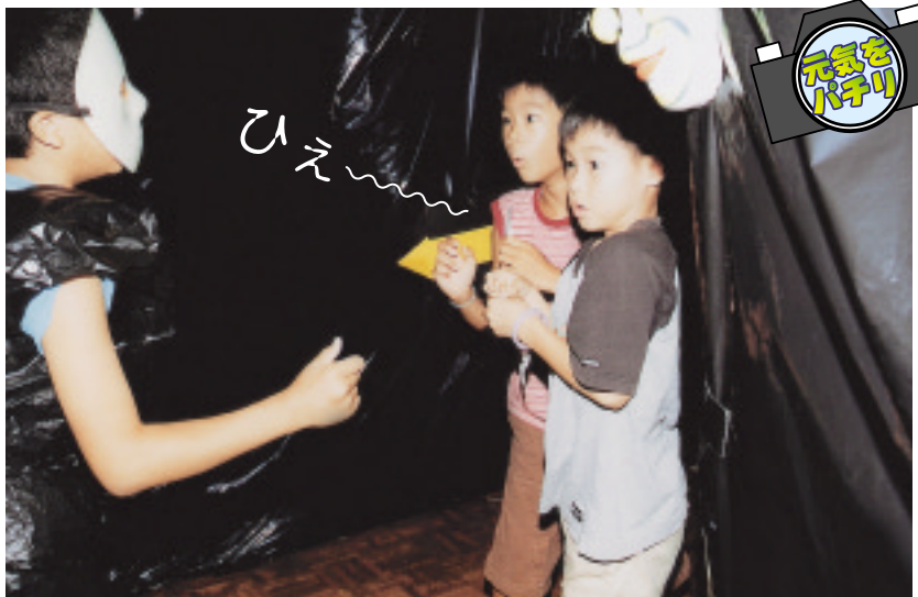
◆モデルさんには、写真をさしあげます。

市報かすが 発行/春日市役所 編集/春日市役所情報政策課広報担当 印刷/(資)四ヶ所印刷 〒816-8501 福岡県春日市原町3丁目1番地5 ☎092(584)1111 URL http://www.city.kasuga.fukuoka.jp/