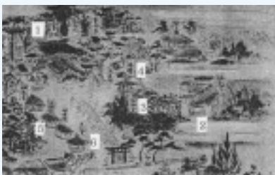
△神仏が習合した江戸後期の宇美八幡宮