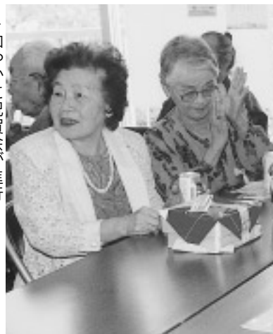
▷和やかに祝賀会が進行

「医者は昔から大嫌い。特に注射を見たら血圧が上がってしまうよ。風邪をひいたら玉子酒を作って安静にしておくのが一番ですよ」