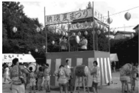
△夏祭りでも新しい太鼓のお披露目

自治会では、さっそく小中学生を集めて練習を開始し、8月3日の夏祭り本番で、その成果を発表しました。太鼓の音は会場中に鳴り響き、おかげで盆踊りもたくさんの人で賑わいました。