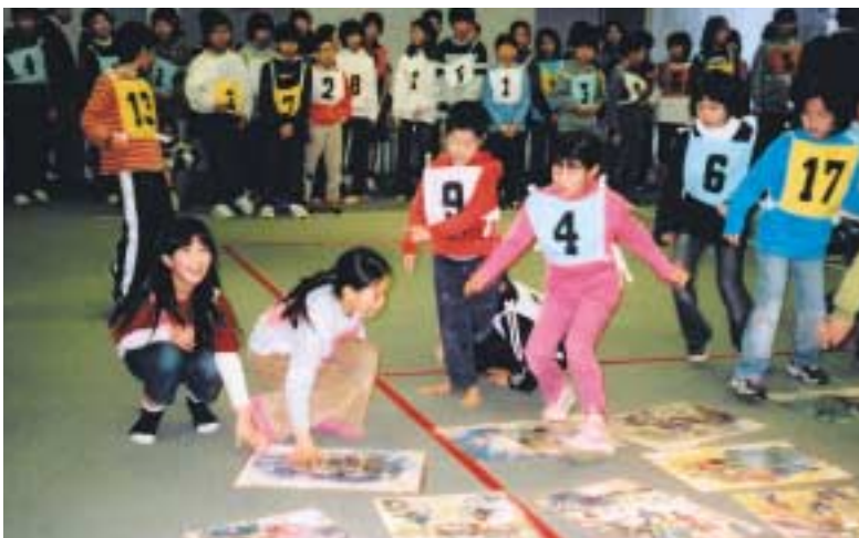
カルタめがけて猛ダッシュ！