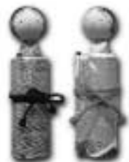
「つづり雛」に関する問い合わせ先松本 ☎(571)6134 (図兼用)