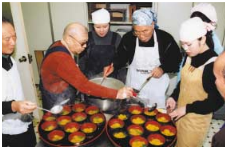
出来上がった料理を手際よくつぎ分ける参加者