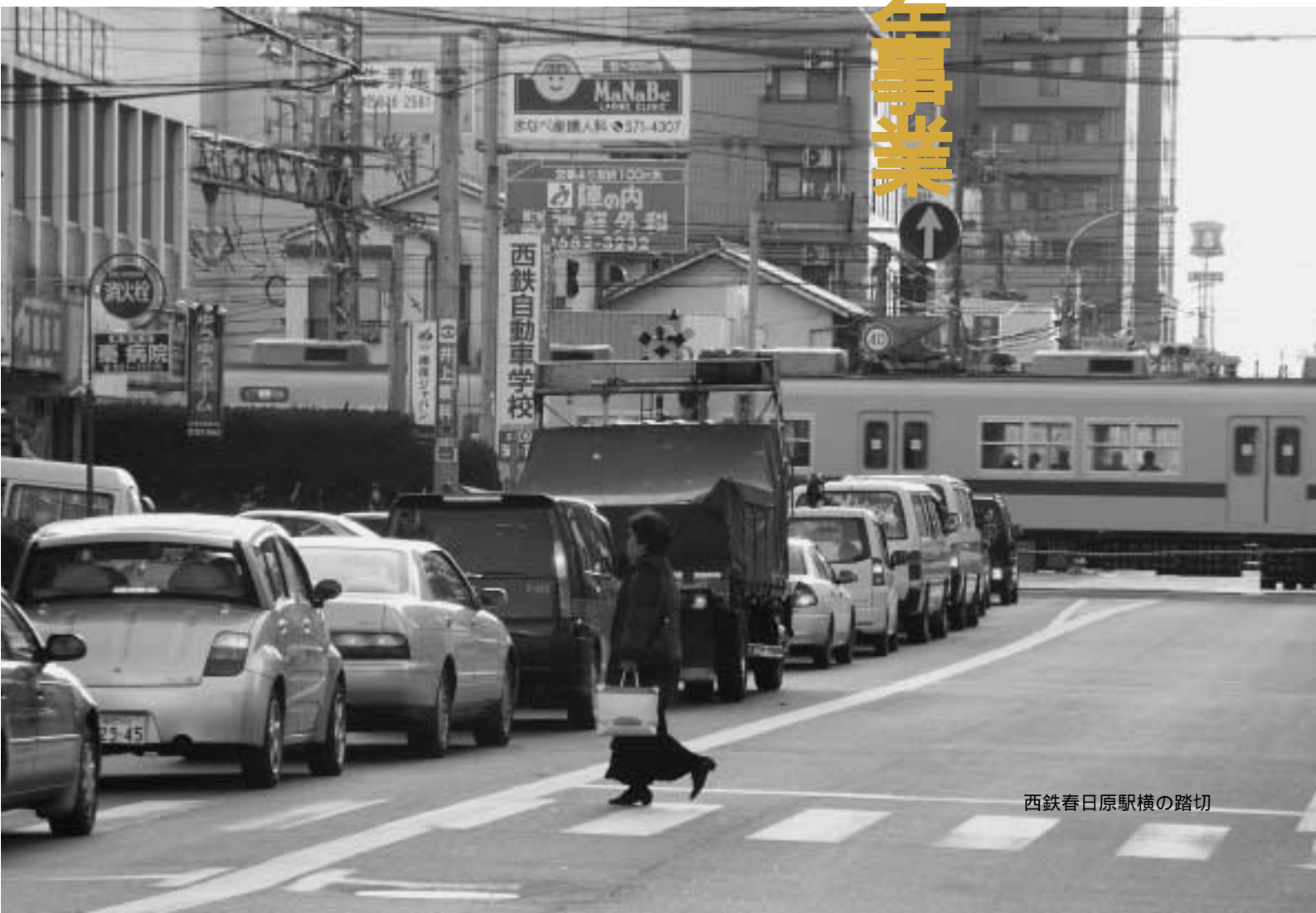
西鉄春日原駅横の踏切

平成9年から進めてきたこのまちづくり構想。今回、福岡県は国土交通省から、この鉄道高架事業の認可を取得しました。この機会にこの構想をおさらいしてみましよう。