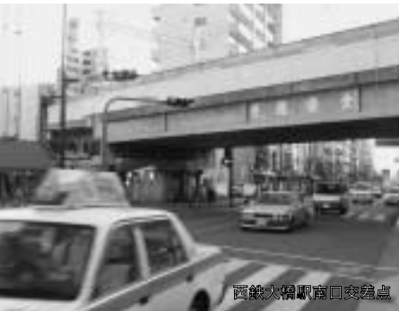
西鉄大橋駅南口交差点

この連続立体交差事業は、平成13年10月に都市計画が決定し、今から事業に着手します。