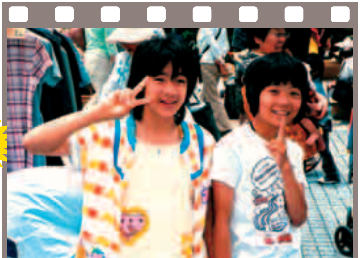
6月5日 春のガレージセール