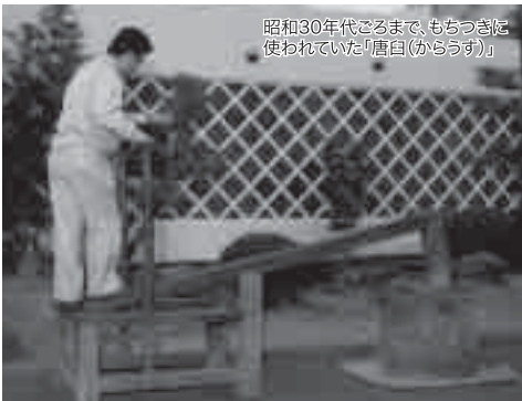
昭和30年代まで、もちつきに使われていた「唐臼(からうす)」

同資料館 暮らしと道具のいまむかし展」のイベントとして、現代と昔の道具を使ったもちつきを行います。親子参加も歓迎します。参加は無料で、申し込みも不要です。 日時 12月17日