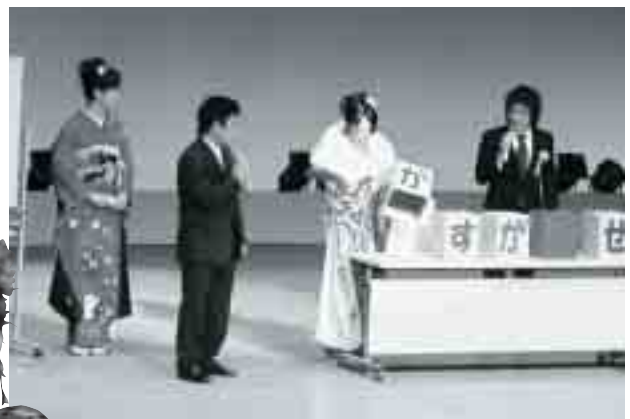
いずれも今年行われた成人式の様子