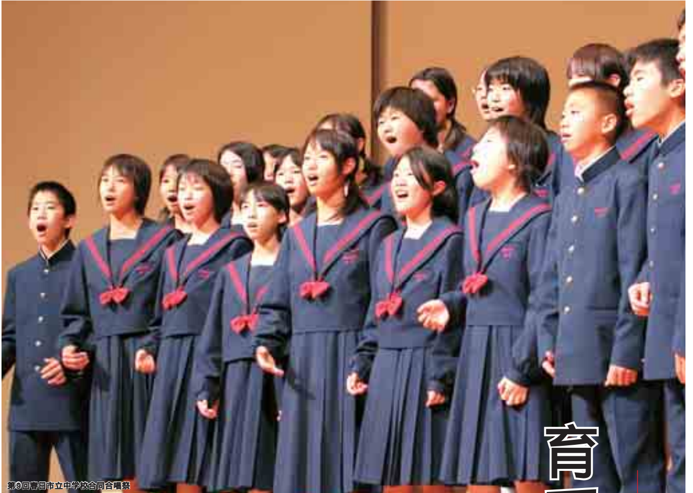
第9回春日市立中学校合唱会