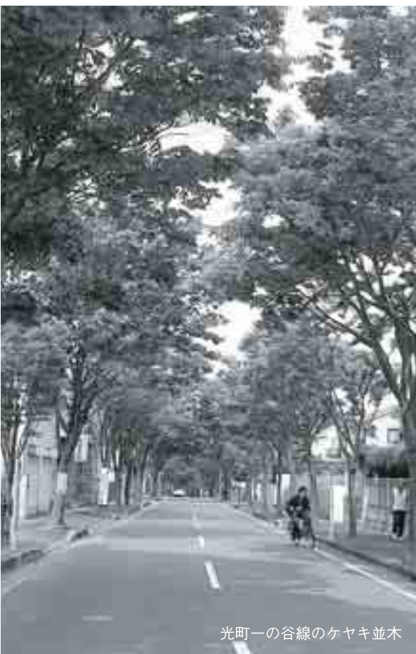
光町一の谷線のケヤキ並木