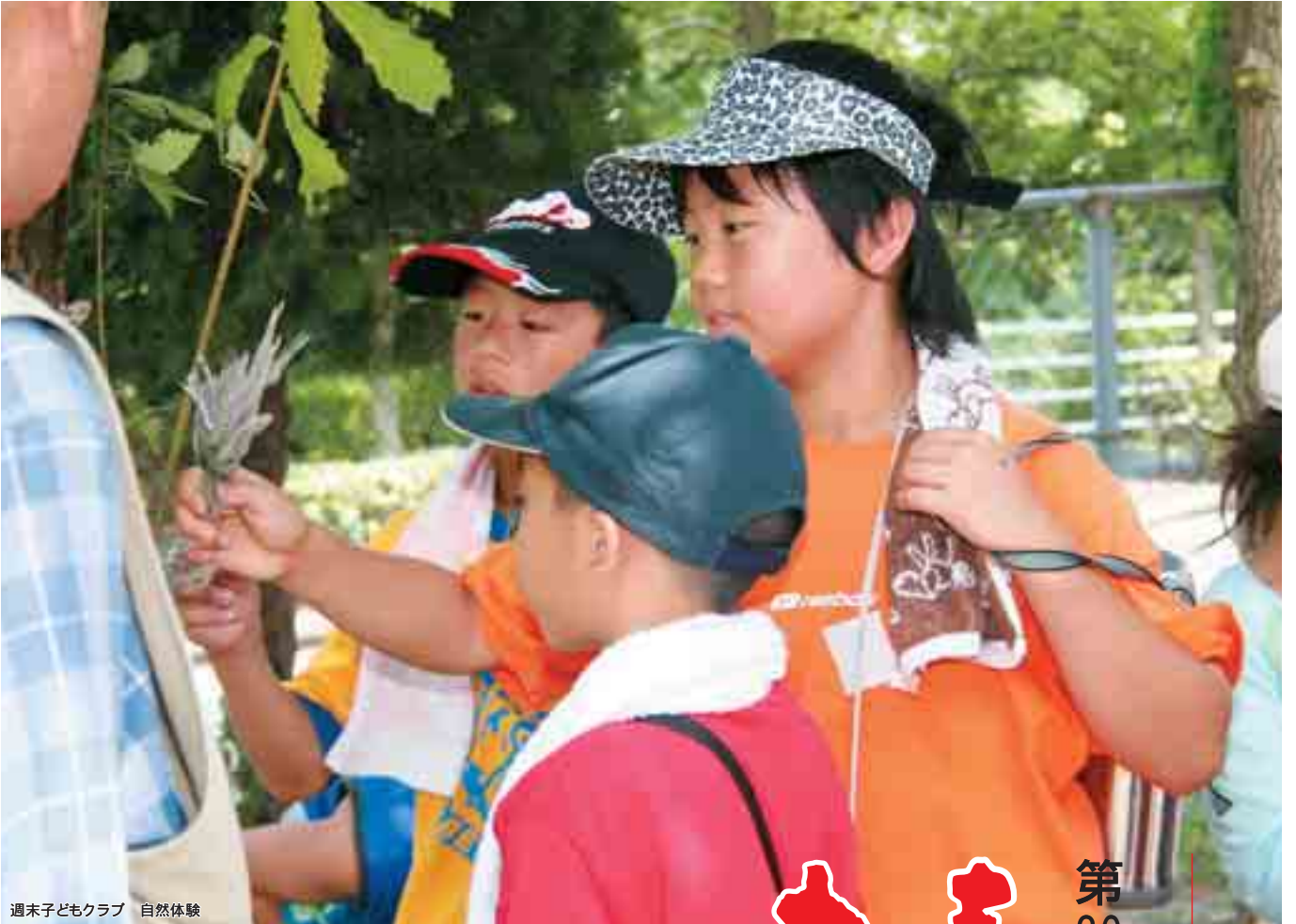
週末子どもクラブ 自然体験