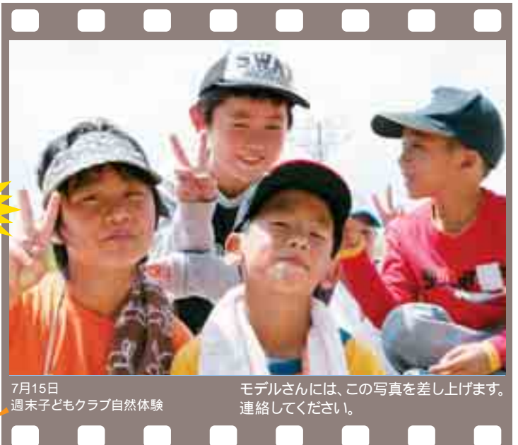
7月15日 週末子どもクラブ自然体験