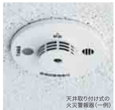
天井取り付け式の火災警報器(一例)