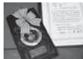
「物理チャレンジ2005」の金メダルと賞状

室の先生に物理の本を紹介され、それを読んで以来、身の周りの物や自然現象の仕組みを自ら知りたいたいと思うようになりました。そのころから高校の物理の参考書で、独自に勉強を始めたそうです。