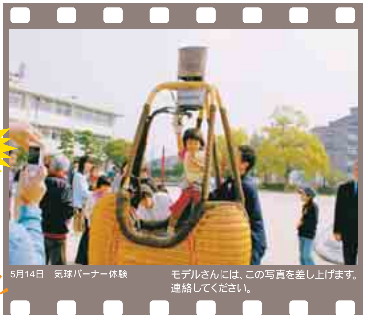
5月14日 気球バーナー体験