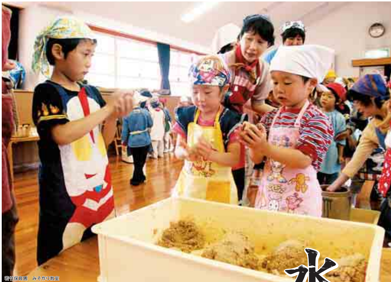
碧竹保育園 みそ作り教室