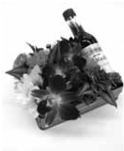
▲ボックスフラワーの工作例