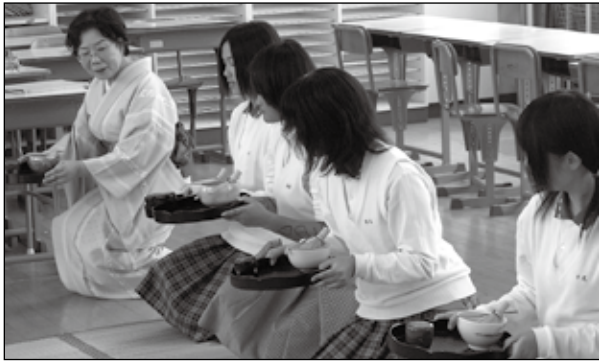
▲星雲タイムでの「茶道」体験活動

校章は、須玖遺跡から発掘された「星雲鏡」という銅鏡の模様由来しています。そこで、本校の生徒を春日西中学校という星雲に集う星に例え、生徒一人一人の力や可能性を伸ばしていくという意味を込めて、本校の教育を「星雲の教育」と呼んでいます。