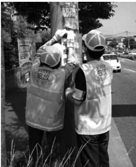
▲登録員による活動の様子です。 街の景観を守るため、ぜひ協力してください。

電 柱や街路灯などに張られたチラシが気になったことはありませんか。これらのほとんどが違法な広告物です。市では、グループで違反広告物の除却活動に協力してもらえる無償ボランティアを募集しています。 現在、塚原台(塚原台すつきり土隊)と日の出町(日の出さわやか隊)の2地区から応募があり、2団体9人の皆さんが6月から活動を始めています。 今後は市内全地区に活動が広まるよう、市民の皆さんの協力と登録をお願いします。