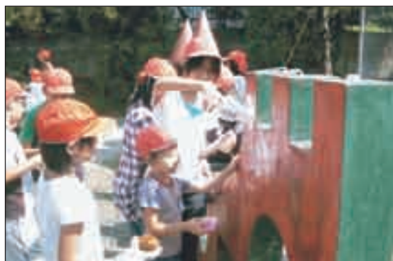
▲縦割りグループで公園の落書きを消す児童たち

学校の教育目標「地域の文化と伝統を愛し、学ぶ意欲にあふれ、チャレンジし続ける子どもの育成」を掲げ、まず第一の特色として、今年度からコミュニティ・スクールを