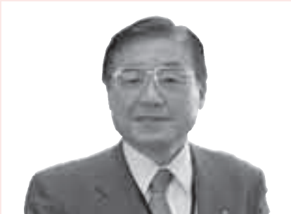
春日市長 井上澄和

これからも、出前トークが、このような市民と行政のコミュニケーションを深める場となるよう努力しながら、皆さまと共に市政運営に取り組んでまいります。