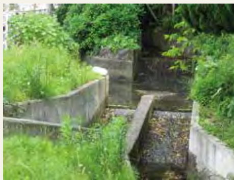
△水量が6対4に分かれるよう、水路の幅に差が付けられています。

白水池から流れてきた水は、現在でもこの定盤分水でおおむね6対4の割合に分けられ、上白水、下白水地区と須玖地区へ流れています。江戸時代の取り決めが、350年を越え今に受け継がれているのです。